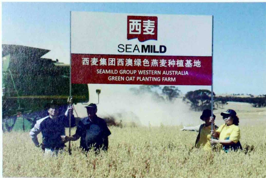
西麦西澳燕麦种植基地

从更深一个层面考虑，我的企业要做燕麦这个健康产品，它能给大众带来健康的利益、带来健康的福报，这是一件多么有意义的事啊！我无数次地发愿要把这种初心布施法界，布施给众生，也是感恩众生对我的成就。我不断对自己和子女们讲，这项事业是值得做下去的，是值得世代做下去的。要用愚公移山的精神做下去，才能真正地传承百年。坚持去做，就是“执”。