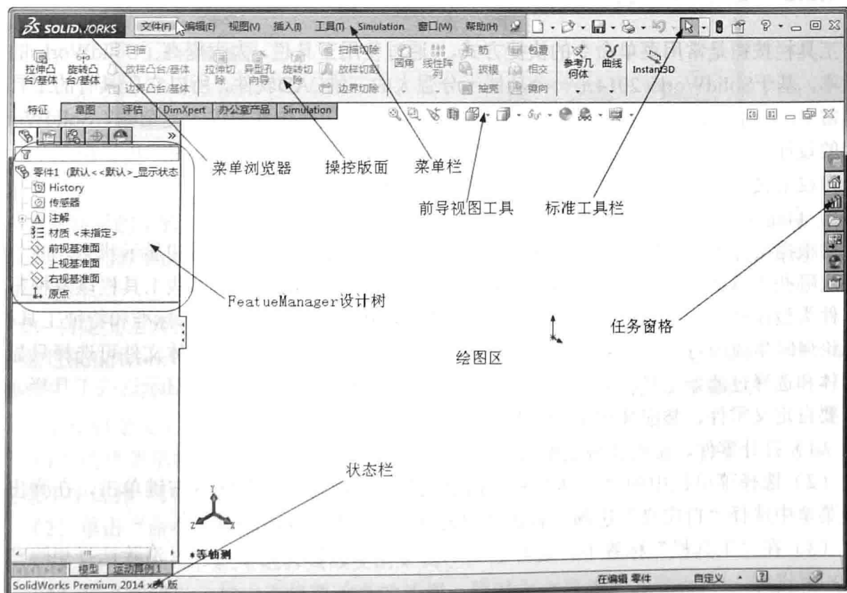
图1-1 SolidWorks 2014界面

通过SolidWorks 2014可以建立3种不同的文件形式——零件图、工程图和装配图,所以针对这3种文件在创建中的不同,SolidWorks2014提供了对应的界面。这样做的目的只是为了方便用户的编辑。下面介绍零件图编辑状态下的界面,如图1-1所示。