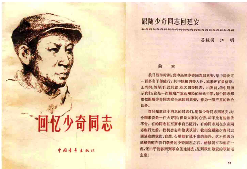
吕振羽、江明回忆《跟随刘少奇同志回延安》