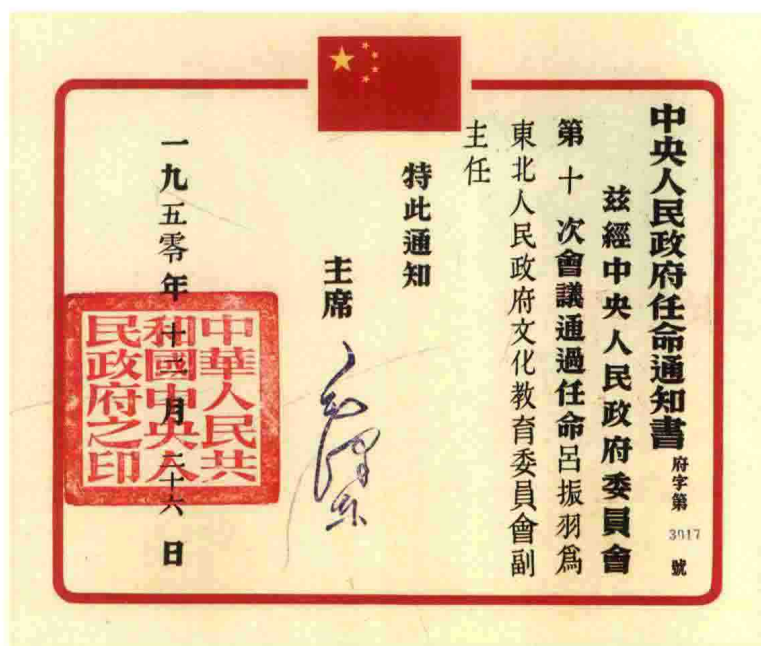
1950年,毛泽东任命吕振羽为东北人民政府文教委员会副主任