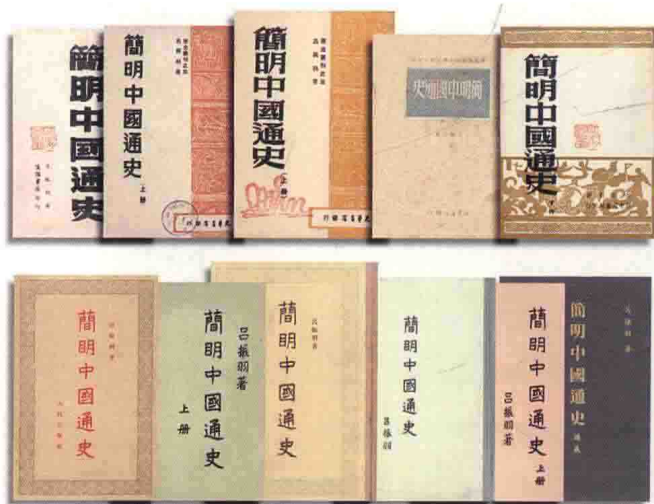
《简明中国通史》出版情况一览