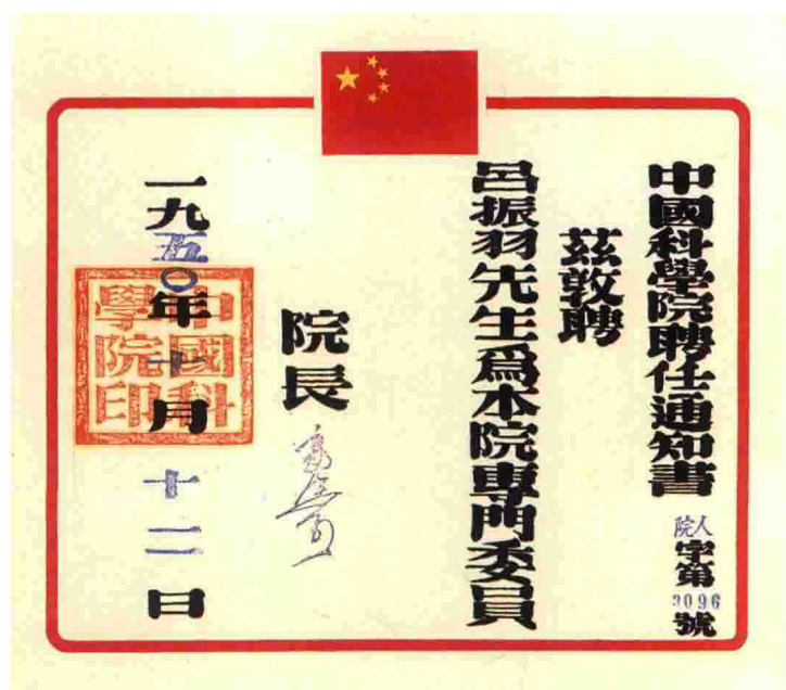
1950年,郭沫若签发的中国科学院聘任书