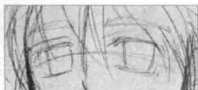
② 在确定好的眼睛位置上画出眼睛的轮廓, 因为画面的视角略带了一点仰视角度, 所以眼睛的弯曲度呈向上的弧线。