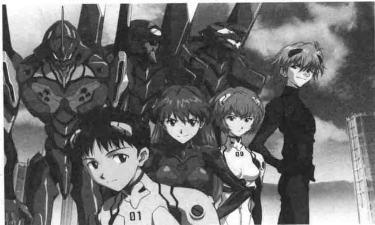
摘自《新世纪福音战士》

这类动漫是当下比较流行的一种漫画风格类型。人物形象以身穿盔甲、驾驭机械物为主，代表作有《新世纪福音战士》、《高达SEED》、《反叛的鲁鲁修》和《全金属狂潮》等。