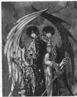
摘自《反叛的鲁鲁修》