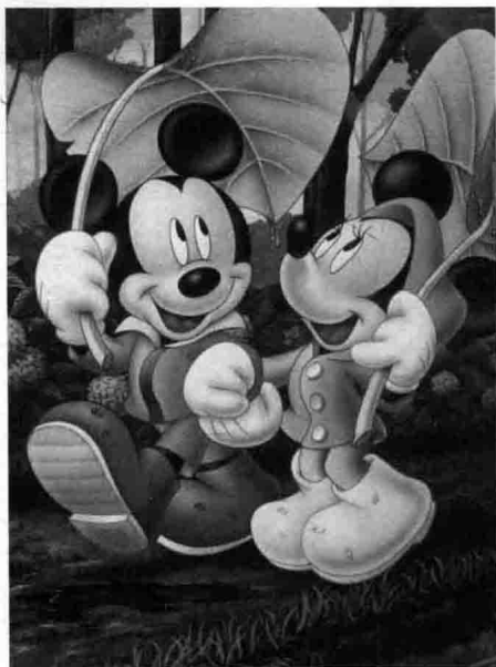
摘自《米老鼠和唐老鸭》

欧美动漫风格是由华纳、迪士尼等为代表发展而来的。最初的2D画面不拘一格，代表作有《米老鼠和唐老鸭》、《猫和老鼠》、《白雪公主》等；如今又衍生出了当下流行的3D动漫，代表作有《冰河世纪》和《玩具总动员》等。