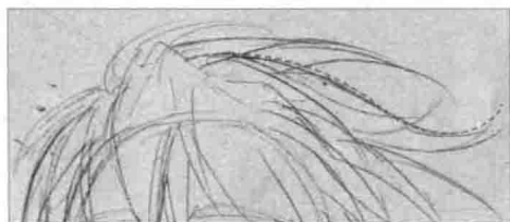
④ 头发是非常重要的部分, 不能画得过于杂乱和平面。我们应该使用弧线画出具有立体感的片状头发。