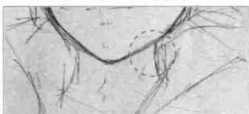
⑤ 下巴和脖子之间有一定的距离, 可以用稍一些的线条将面部和脖子的距离感表现出来。另外, 注意男性的脖子上会有喉结。