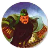
关羽 Guan Yu: sworn brother of Liu Bei and Military General