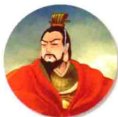
刘备 Liu Bei: warlord and founder of Shu