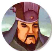
鲁肃 Lu Su: Administrator of Wu and successor to Zhou Yu