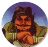
张飞 Zhang Fei: sworn brother of Liu Bei and Military General