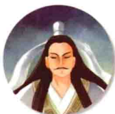
诸葛亮 Zhuge Liang: Military Advisor to Liu Bei and Prime Minister of Shu