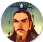
孙权 Sun Quan: warlord and founder of Wu