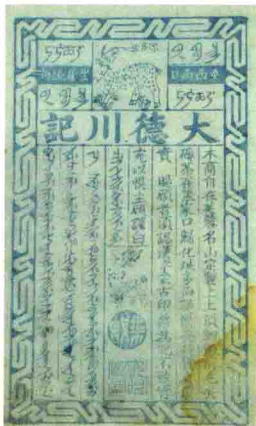
◎图1-5 旅日、旅蒙晋商广告