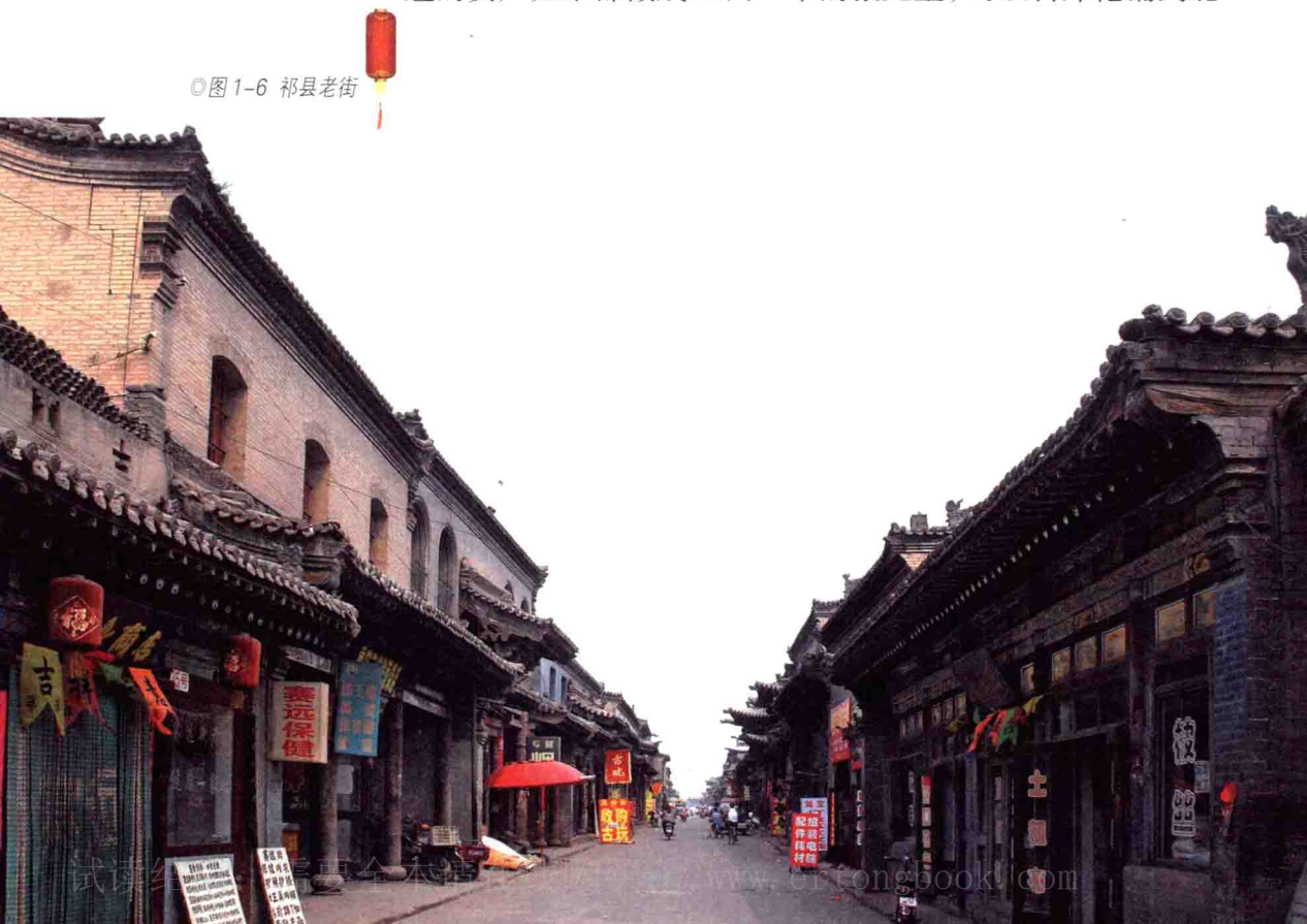
◎图 1-6 祁县老街

口外贸易的商人群体。自明代末年开 始，祁县人 就通过东西两口（东口张家口、西口杀虎口），前往蒙古族居住区进行贩运贸易。旅蒙商一般以张家口、包头、归化（今呼和浩特）为基地，以库伦（今蒙古国乌兰巴托）、买卖城（今蒙古国阿勒坦布拉格）等地为交易中心，在东至 伊 尔 库 茨 克、西 至 莫 斯 科 的 广 大 地 域 建 立 起 覆 盖 整 个 欧 亚 大 陆 的 商 贸 网 络，是晋商锐意进取、百折不挠的杰出代表。旅蒙商帮中最出色的主要有乔家的复字号、大盛魁、兴盛魁等。乔家复字号缔造了“先有复字号，后有包头城”的经营神话。大盛魁同样十分了得，鼎盛时职工达到六七千人，骆驼商队有骆驼两万余峰，周转资本仅外蒙古地区就达白银 1000 万两以上。民间传说，大盛魁的资产如果都做成 50 两一个的银元宝，可以自库伦铺到北