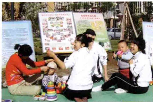
北京军区司令部幼儿园走进社区开展早教咨询活动