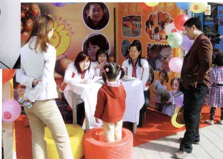
举办“多彩童年”学前教育专题游园活动