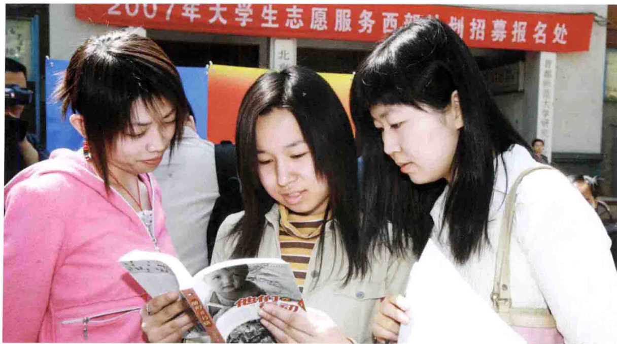
首都师范大学启动志愿服务西部计划招募工作