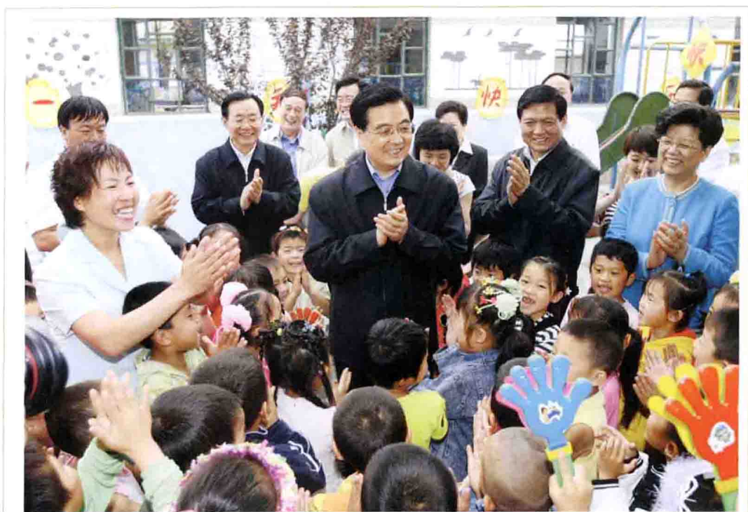
胡锦涛同北京郊区少年儿童一起欢度“六一”国际儿童节