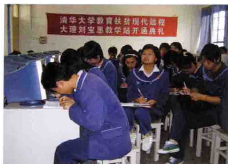
清华大学建设全方位教育扶贫网站