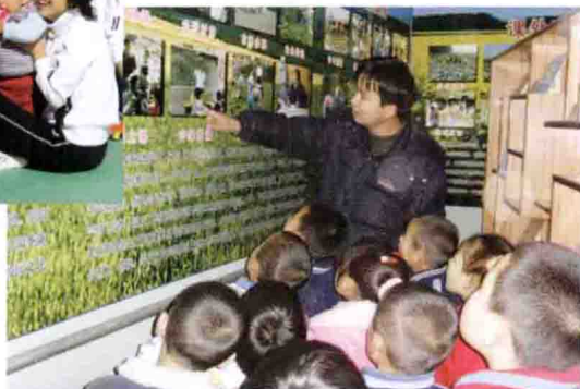
延庆小丰营中心小学建成校本课程展览室