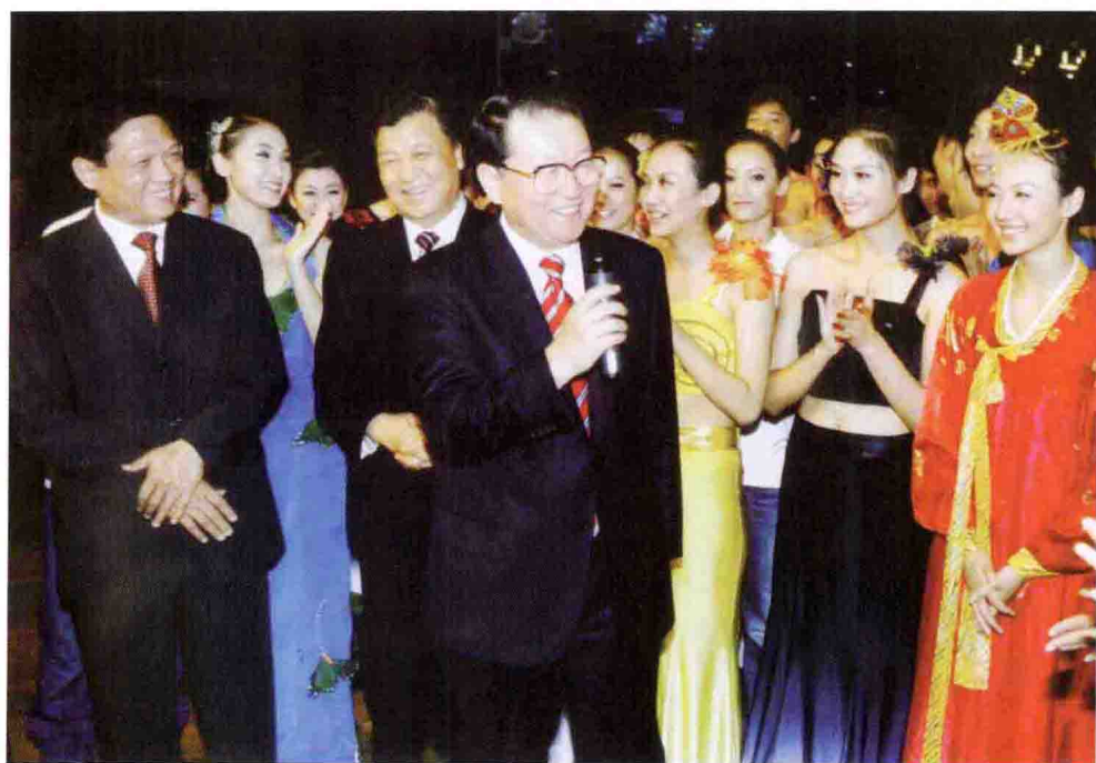
李长春观看首都大学生迎奥运主题晚会后与演员见面