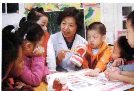
举办“爱护牙齿”保健系列活动