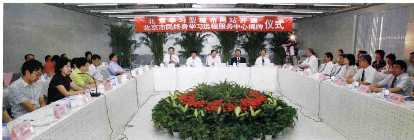
北京学习型城市网站在北京广播电视大学开通