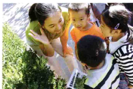
组织幼儿教育活动