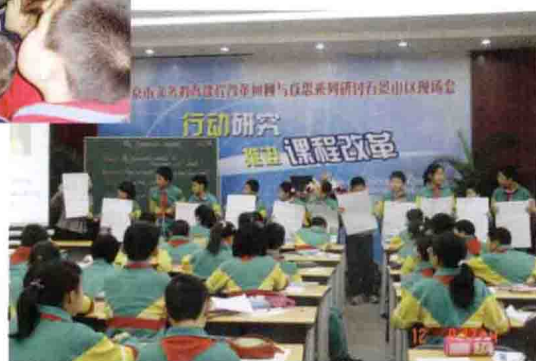
北京市义务教育课程改革回顾与反思研讨会在石景山区召开