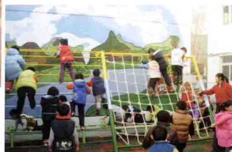
重视肥胖儿童卫生保健工作