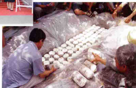
怀柔区职业学校为农民培训栗 树蘑种植、摆放菌棒技术