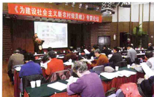
北京农业职业学院举办 “为建设社会主义新农村做贡献”专家论坛