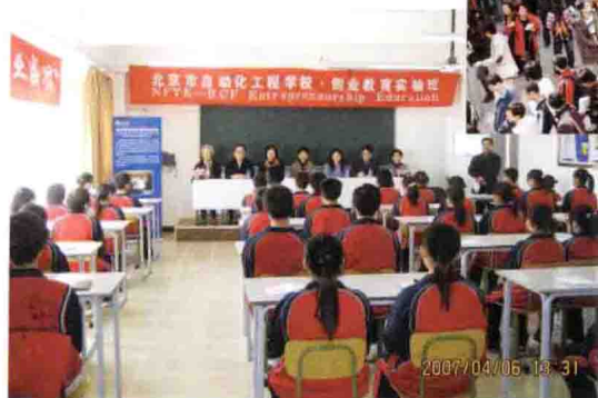
北京市自动化工程学校举办创业教育实验班