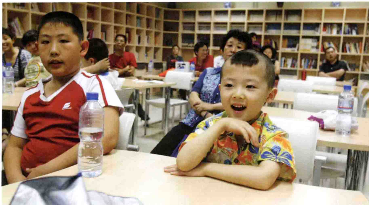
东城区市民学习基地启动