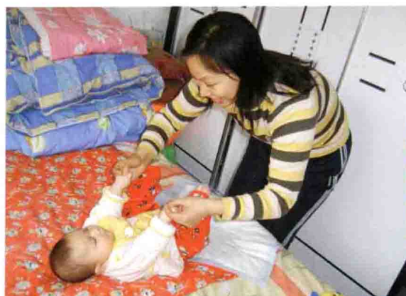
早期教育深入家庭