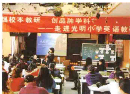
崇文区在光明小学举办新课程英语校本教研活动现场会