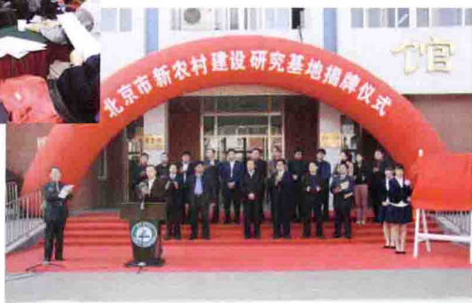
北京新农村建设研究基 地在北京农学院落成