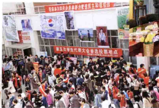
中国农业大学组织学生会普选