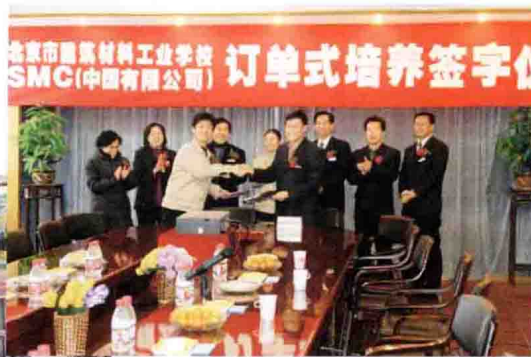
北京市建筑材料工业学校与 SMC 公司签署订单式培养协议