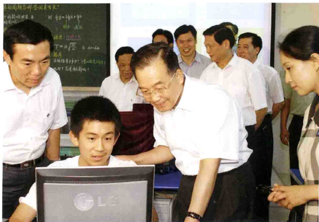
温家宝视查北京市第四中学