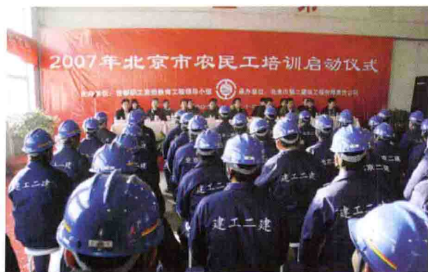
总工会职工大学建立首个农民工业余学校培训基地