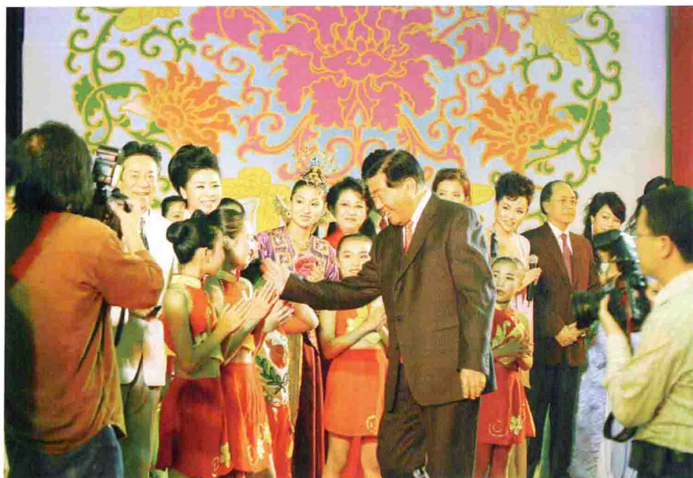
贾庆林会见昌平区少年宫小演员