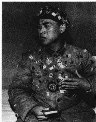
图 1-3 摄影作品《虔诚者》 (李振盛, 1968)

例如，1968年的摄影照片《虔诚者》，通过简单分析，可以看出该作品所具有的丰富的历史、文化和哲学内涵。这不仅仅是一张肖像照，它既是写实的，又是虚拟的；它既是历史的，又是当下的；它通过对肉体摧残的展示，象征灵魂被控制的恐惧。与其说照片中的主人公是虔诚的，不如说他是恐怖的。在他的表情中看不到丝毫的人世温情，显现的是被权力吞噬从而扭曲了的灵魂。更深一步去分析，可以看出，通过对肉体摧残和压制，人的灵魂和尊严极易被控制。这张照片表达的不仅仅是1968年中国那个特殊的历史时期，其实它还揭示了人的本性，在任何一个时代，这就是人自身。所以，作为一幅摄影照片，它确实是写实的，但是它又是虚拟的和开放的，其中蕴藏着无限解释的可能性。媒介批评就是要挖掘其中无限可能的意义。