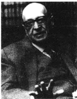
图 1-2 马克斯·霍克海默

法兰克福学派的社会批判理论是“批判”理论和方法的又一重要基础。“法兰克福批判学派”的批判理论，主要指的是一种解释性的、规范性的、实践性的和自我反思性的社会理论。法兰克福“批判学派”的“批判”一词，最先由德国社会学家霍克海默重点加以阐释(图 1-2)，用于法兰克福学派思想家团体，主要指的是与法兰克福社会研究所成员有关的一种社会批判的理论形式。该学派主要是对当代西方现代工业文明发展中的社会文化的批判研究，具有强烈的现实批判精神。学派代表人物有霍克海默、卢卡奇、本雅明、葛兰西、马尔库塞、阿多诺、萨特、戈德曼、阿尔都塞等。