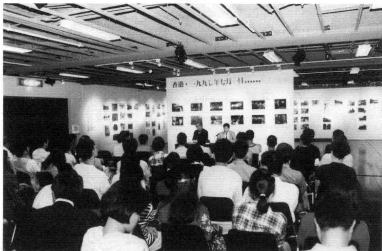
「從台灣看香港歷史」對談現場情形