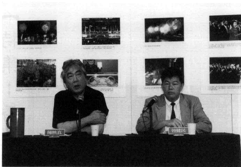
陳映真·曾健民對談「從台灣看香港歷史」