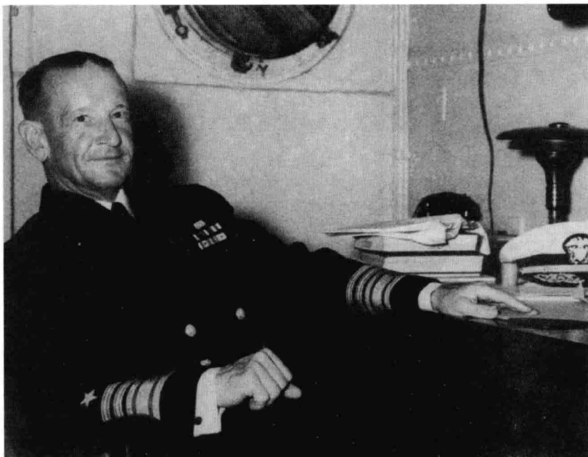
弗兰克·杰克·弗莱彻中将，摄于1942年9月17日。