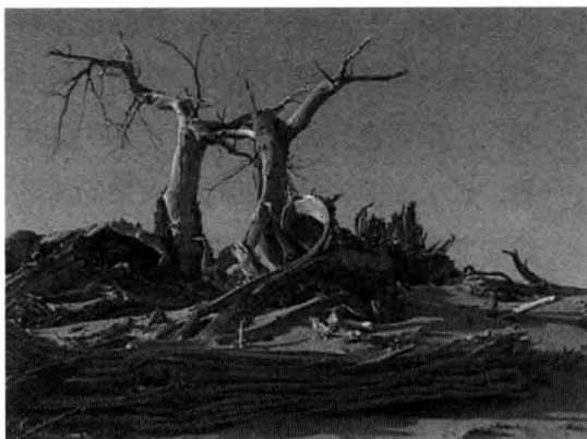
干裂的土地，给我们敲响了警钟。

“原以为你无限宽广，不在乎失去一片阴凉。原以为你有无穷宝藏，不在乎掠走一点安详。原以为你无比坚强，谁知你的泪在流淌。”曾经，我们为了实现经济的高速发展，向自然掠夺和索取资源，如今，干裂的土地、巨大的矿坑，资源枯竭愈演愈烈，资源包袱日渐沉重，地大物博已经成了一个美好的童话。