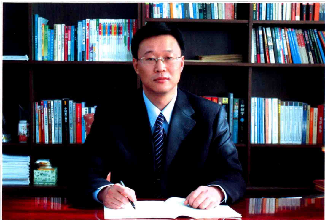
● 松原市委副书记、代市长 孙鸿志

全面、客观、真实地记述市情，发挥好“资政、存史、教化”作用，举全市之力，集全市之智，努力把松原建设成为创业环境优、人居环境佳、综合竞争力强、特色鲜明的区域性中心城市。