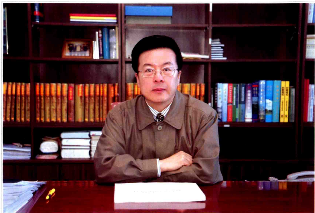
● 松原市委书记 蓝 军

加快推进松原经济更快更好地发展,提前实现“十一五”规划,到“十一五”期末实现“双—”(地区生产总值达到1 000亿元,全口径财政收入实现100亿元)的奋斗目标,让改革发展的成果更多地惠及广大群众。