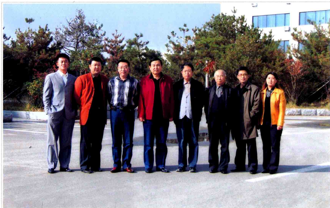
● 《松原市志》编辑部全体成员