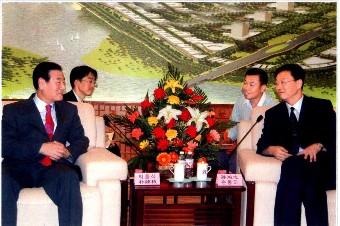
● 市委副书记、代市长孙鸿志与外商洽谈投资事宜