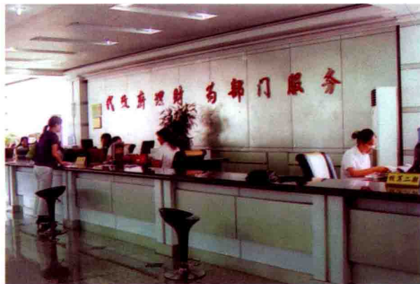
● 政务大厅财政窗口