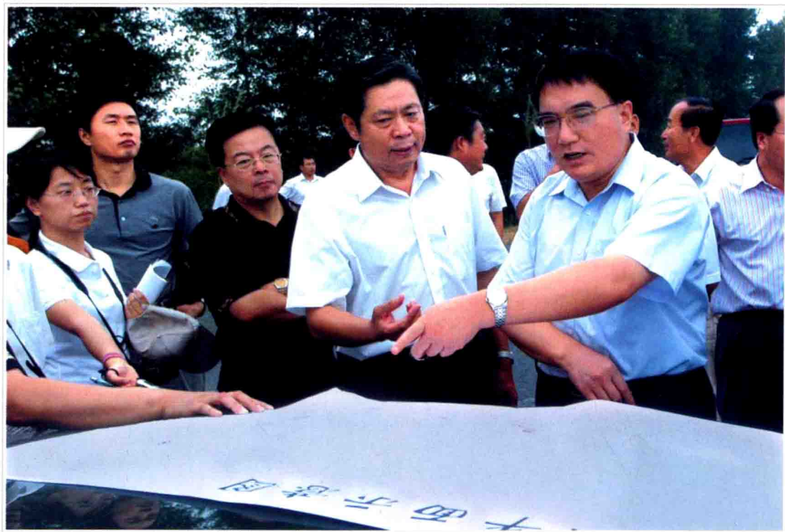
● 省长王珉到松原市检查指导工作