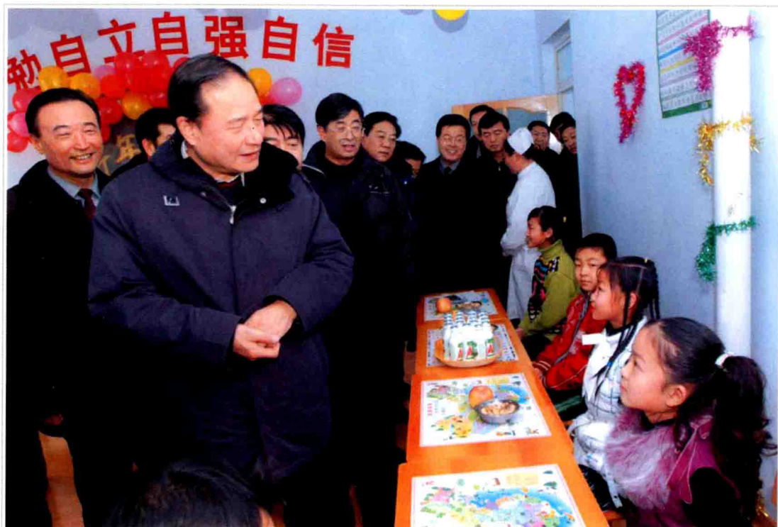
● 省委书记王云坤到松原市调研