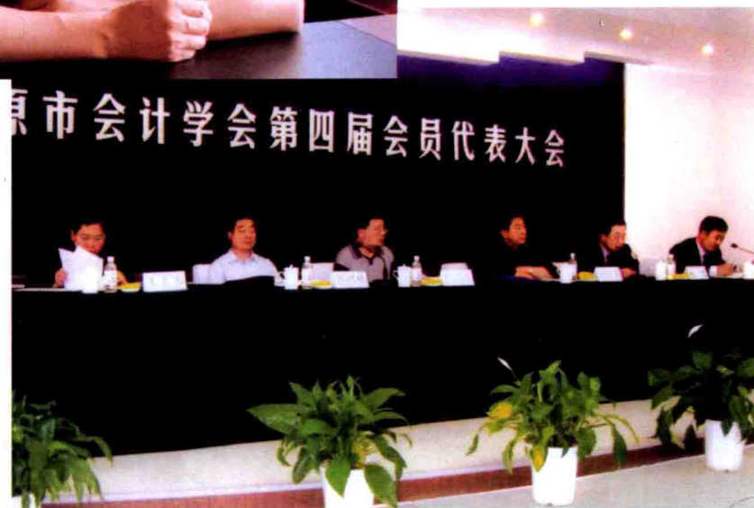
● 会计学会第四届会员代表大会