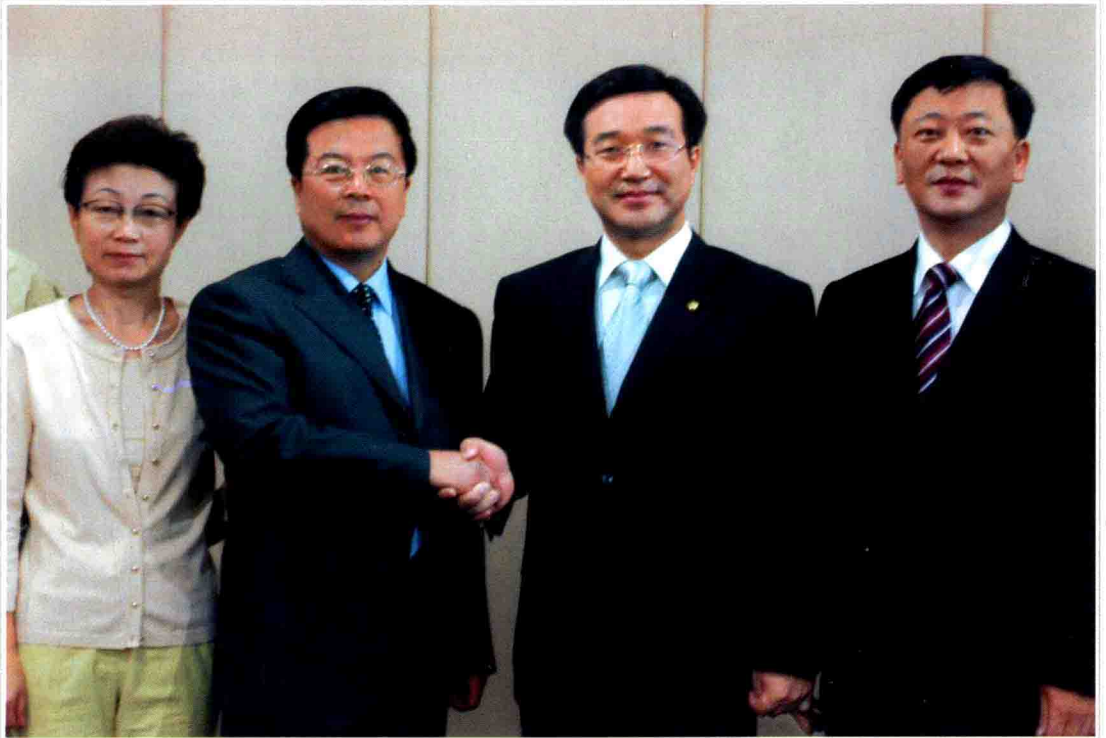
● 市委书记蓝军会见韩国客商