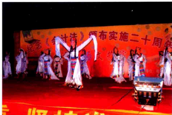
● 《会计法》颁布二十周年市政广场文艺演出