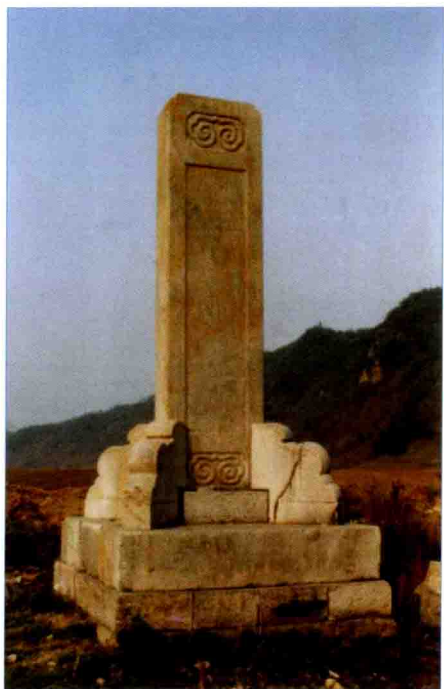
镌刻着“诸王以下官员人等至此下马”五种文字的下马碑。