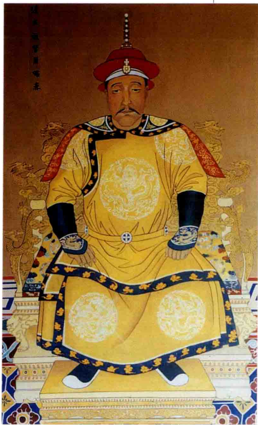
清太祖高皇帝努尔哈赤画像。