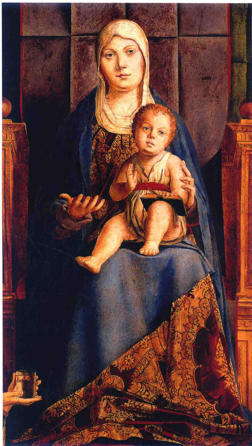
安东内罗·达·梅西纳，《圣卡西亚诺祭坛画》(局部) 约 1475—1476