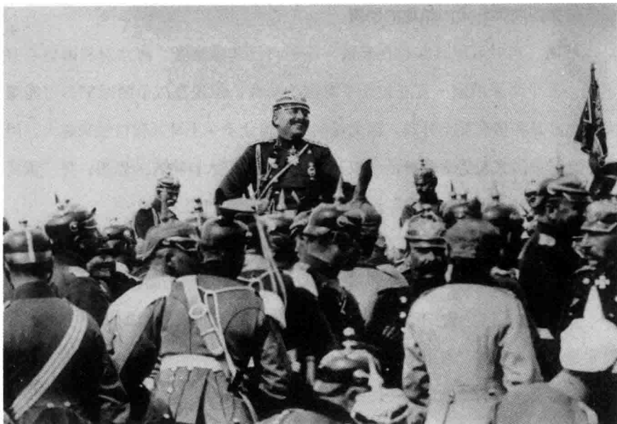
◎ 1905年9月，德皇威廉二世骑着骏马，由他的军官们陪同，在陶努斯山脉参加皇帝年度阅兵式。

眈。因此，英德两国的政策愈发不可调和，直至后来德国出动军队，同英国进行全球海陆作战。