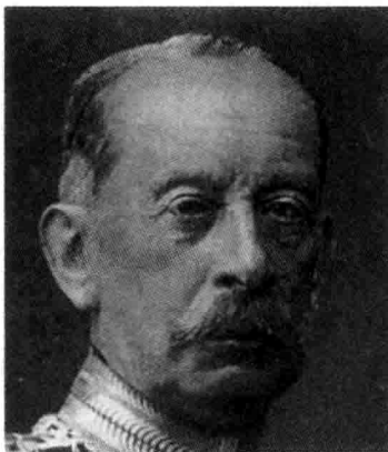
◎ 陆军元帅阿尔弗雷德·冯·施里芬，1891—1905年间的德军总参谋长，期间制定了德军的进攻作战计划。他提出了一份两线作战计划，德军需要在俄国完成总动员之前，对法国速战速胜。

当时俄军正向德国边境以东地区缓慢推进，于是他计划在在该地区部署一支小规模部队，拖延俄军几周时间。而在西线，他将集结大批兵力，在六周之内大败法军。施里芬认为如果要击败法军，德军在攻至法德交界处时必须暂停进攻，届时法军一定会调来大批兵力，对他们丢失的阿尔萨斯和洛林两省发起进攻。这将正中他的下怀，因为他打算在该地区部署一支强有力的德军防御部队，对法军迎头痛击，而这支部队将与法军运输线保持一定距离。赢得这场防御战的胜利之后，德军将更加气势如虹，进而一举征服整