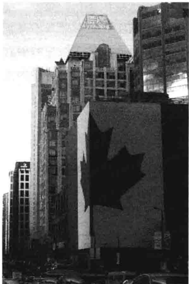
2010年，温哥华冬奥会街头，身披国旗的大厦