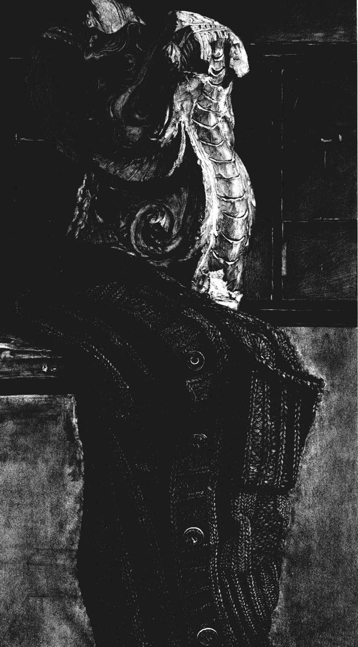
图1-5 带毛衣的静物 / 李青