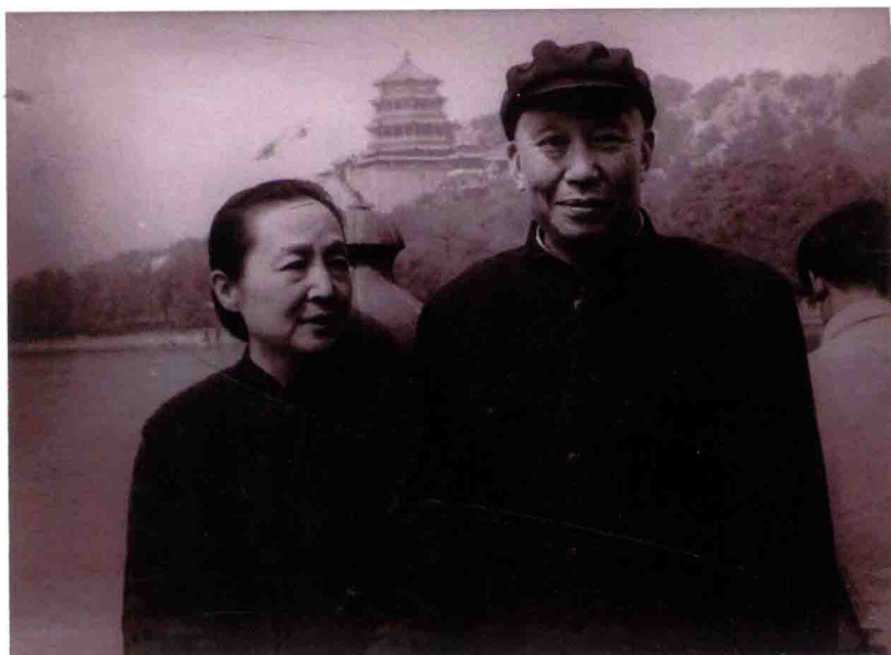
和夫人在頤和園（二十世紀六十年代）