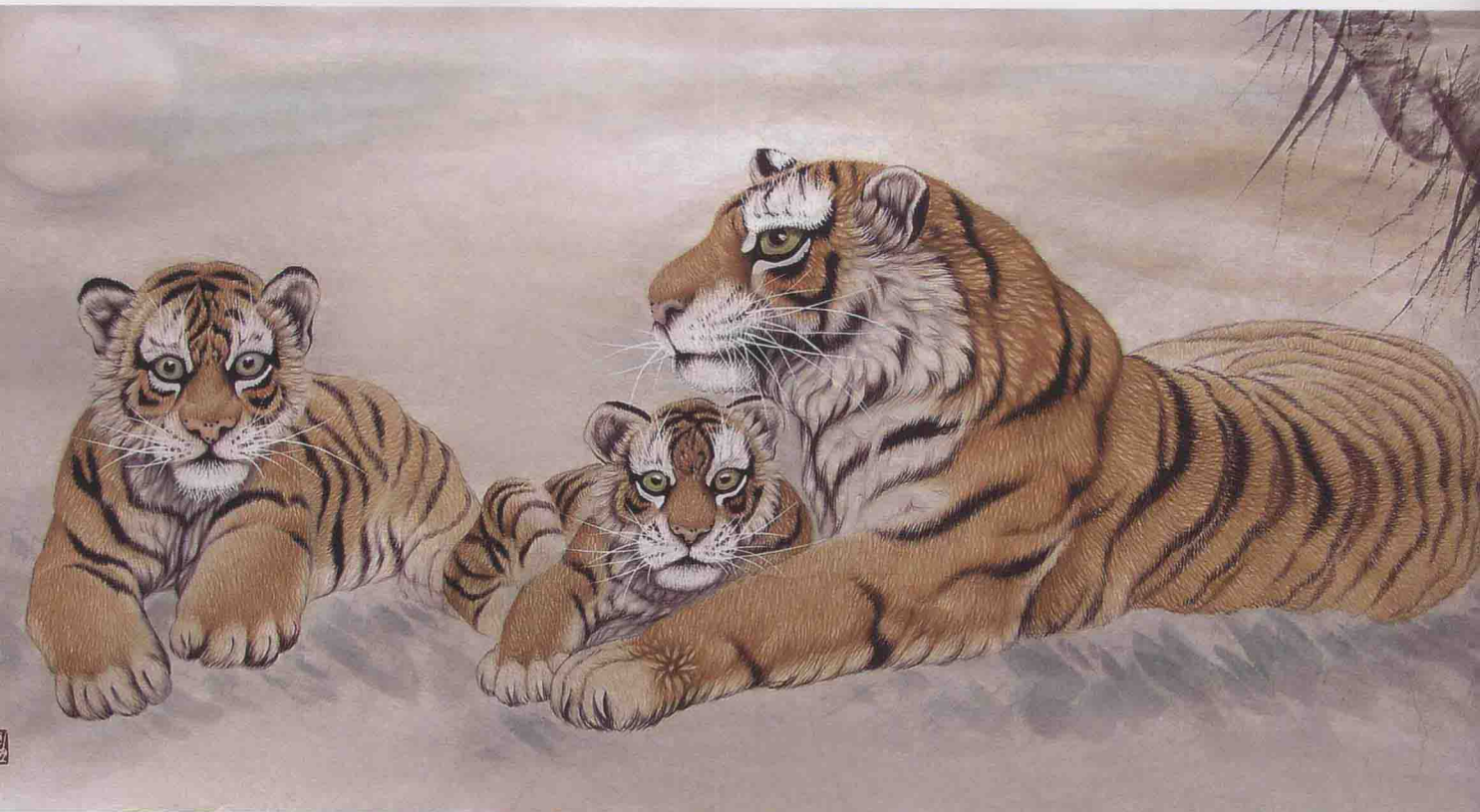
《母子情》 68cm × 138cm