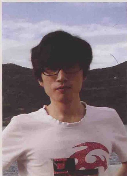
高利民 GAO LIMIN 艺术简介