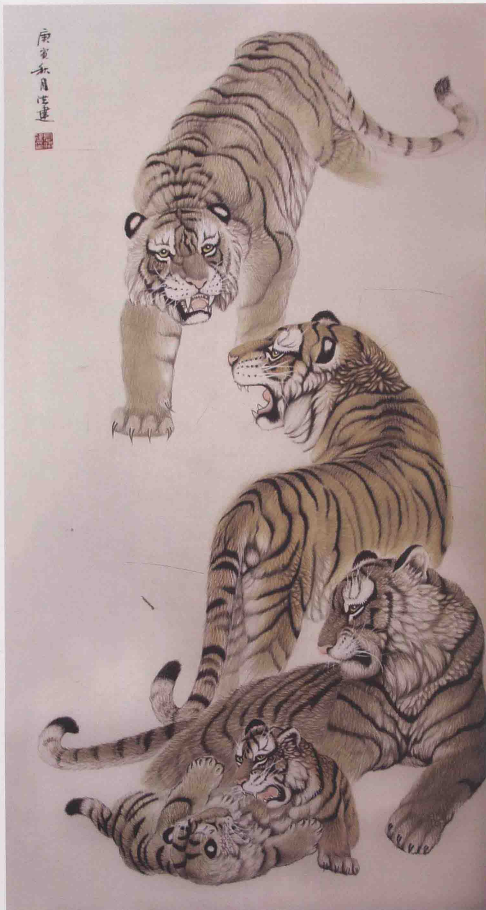
《五福图》 68cm × 138cm