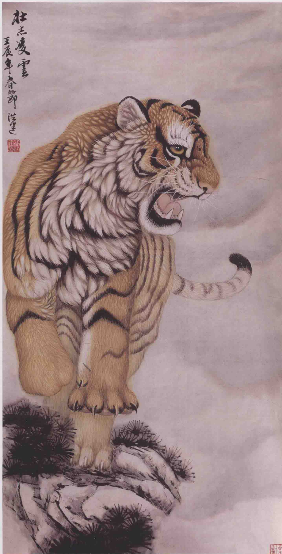
《壮志凌云》 68cm × 138cm