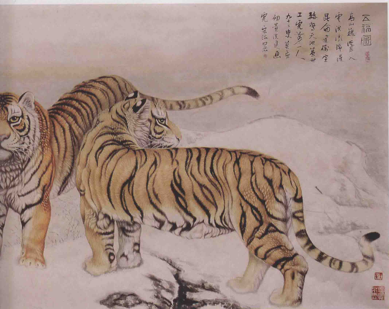
《五福图》 380cm × 148cm