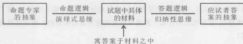
图 1—1 申论命题与答题的思维逻辑图

申论唯物论揭示了申论答案的本源。物质第一性还是意识第一性,是哲学的元问题,也就是哲学的本质问题。唯物论和唯心论历来是哲学上的最大争论。我们必须清楚,唯物论是马克思主义哲学的基本观点和立场,马克思主义认为世界是物质的,物质是运动的,物质决定意识,意识对物质具有能动的反作用。在申论考试中,我们要坚决贯彻马克思主义的立场、观点和方法。申论考试中的唯物论,就是唯材料论。申论考试为什么要坚持唯物论或唯材料论呢?这是由申论的命题逻辑和答题逻辑决定的(见图1—1)。