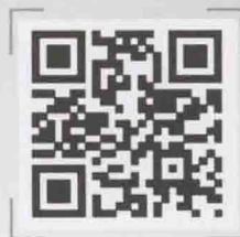
华图网校移动客户端