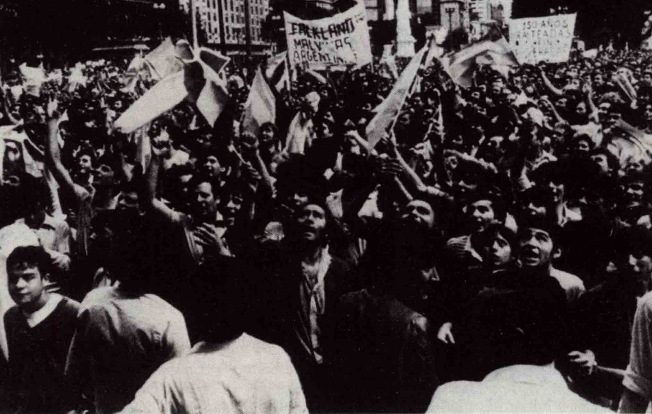
▲ 群情激愤的阿根廷人走上街头抗议英国侵占马岛。

支路过的德国舰队发起突然袭击，一举击沉4艘德国巡洋舰。此战史称“福克兰海战”，作为海上突然袭击的著名战例而被写入许多国家的海军教科书。