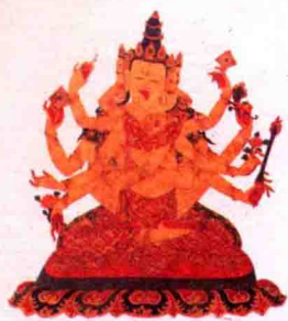
密集金刚与触摸金刚母