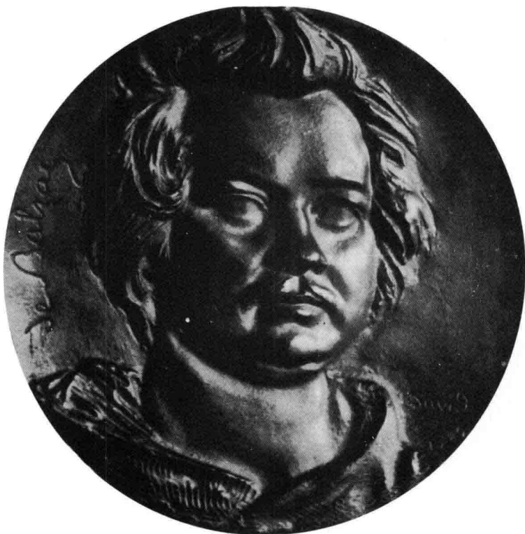
巴尔扎克，大卫·安格尔作