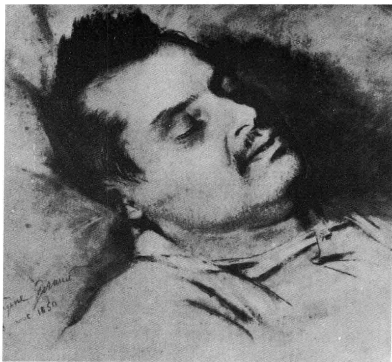
临终时的巴尔扎克，欧仁·吉罗绘制