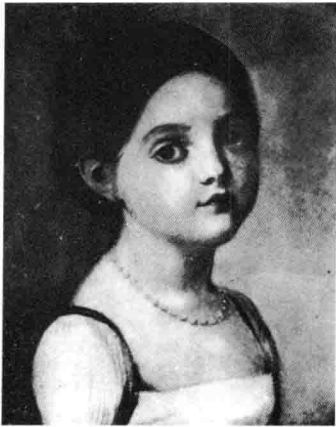
洛尔·巴尔扎克，巴尔扎克的妹妹