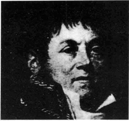
贝尔纳-弗朗索瓦·巴尔扎克，巴尔扎克之父