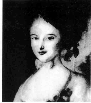
洛尔·萨朗比耶，巴尔扎克之母