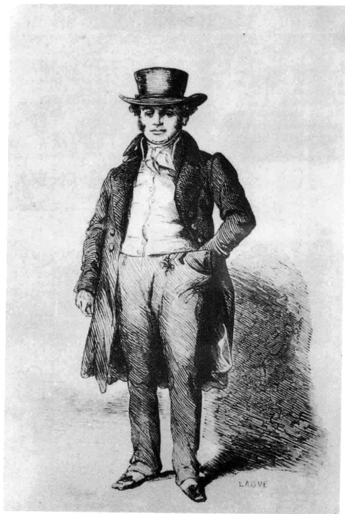
《赛查·皮罗托盛衰记》插图，1837年