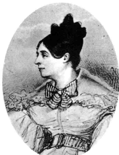
阿布朗泰斯公爵夫人