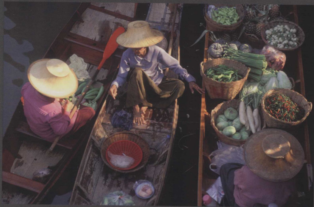
水上市场的辣椒交易，泰国当能沙朵 (Damneon Saduak, Thailand)