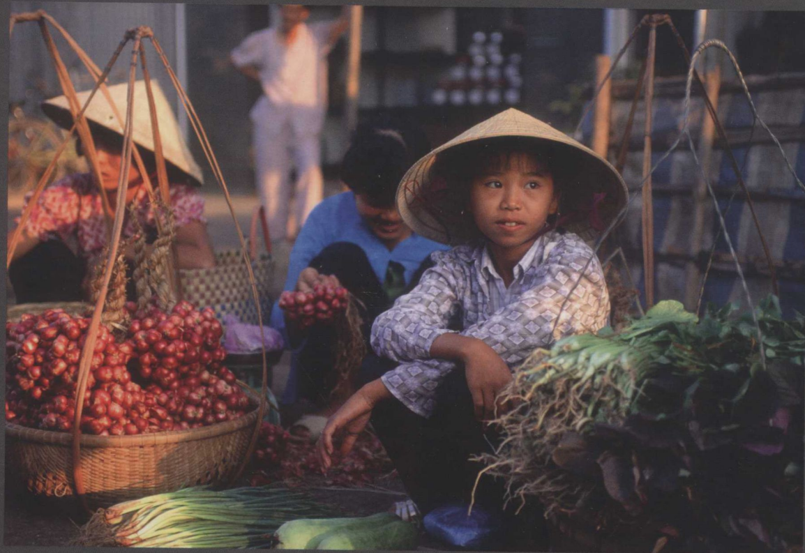
在湄公河三角洲一个市场卖蔬菜的一个小女孩，越南槟知 (Ben Tre, Vietnam)