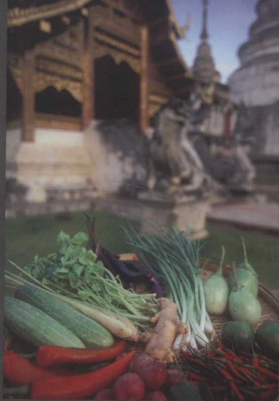
帕邢寺 (Wat Phra Singh) 旁的一个装满泰国蔬菜的大盘， 泰国清迈 (Chiang Mai, Thailand)