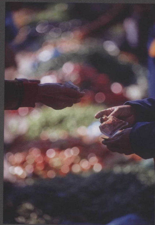
找零钱，中国云南省，大理附近，洱海瓦色市集