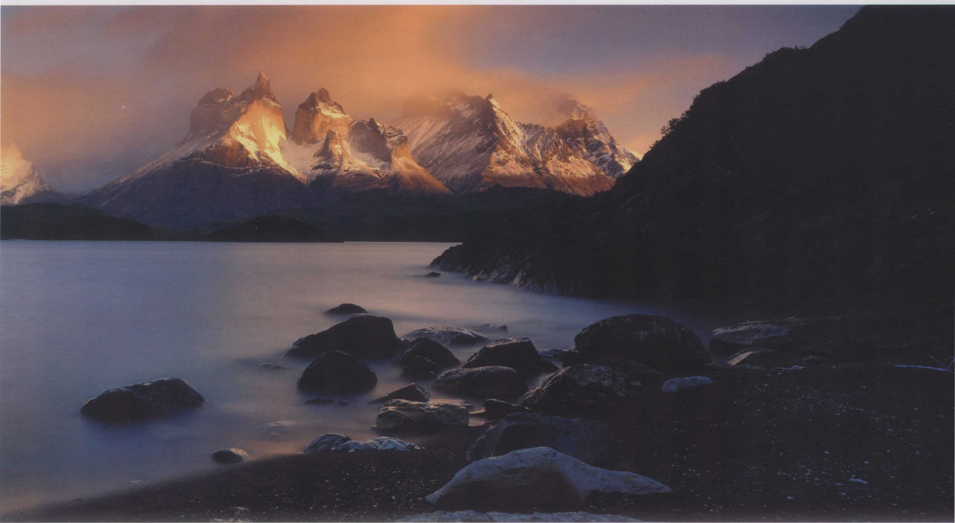
佩霍伊湖和托雷斯德帕伊内 (Lake Pehoe and the Torres del Paine), 智利巴塔哥尼亚 (Patagonia, Chile)