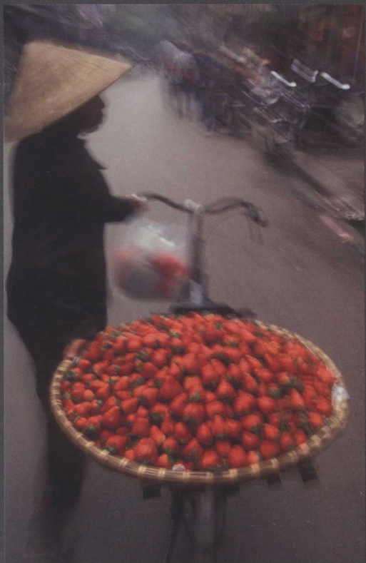
移动中的草莓，越南河内（Hanoi, Vietnam）

① lemongrass：一种香茅，香茅属的热带草，原产于印度南部和斯里兰卡，能从中提炼出一种香油，用来调味或制造香水或药物。——译者注