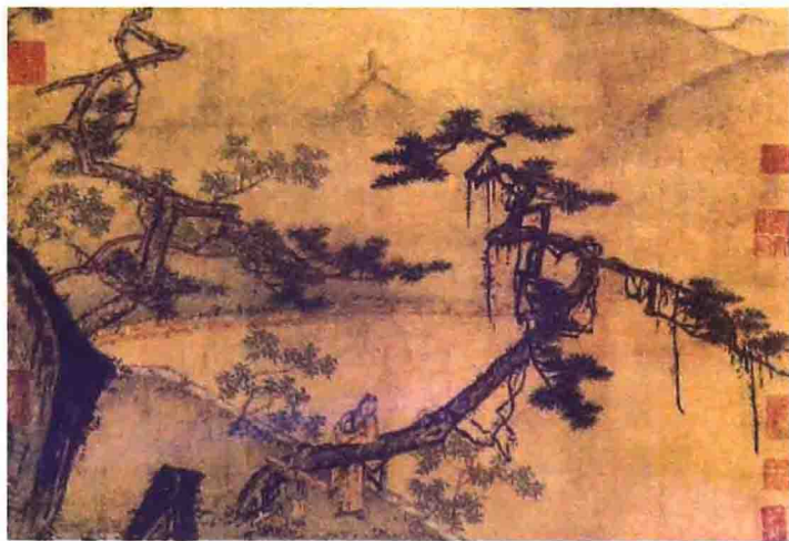
南宋·马远《倚松图册》 《倚松图册》画笔精妙，为马远的杰作之一。南宋绘画多用绢本，而《倚松图册》以纸本着色，较为少见。马远把一老一少两人置于山色若隐若现、松枝横斜临水的环境中，表现了宋代文人士大夫恬淡安适的居家闲态。