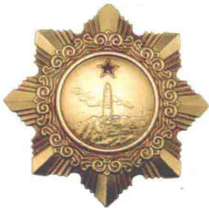
方强老将军荣获的 一级八一勋章、 一级独立自由勋章、 一级解放勋章 和一级红星功勋荣誉章