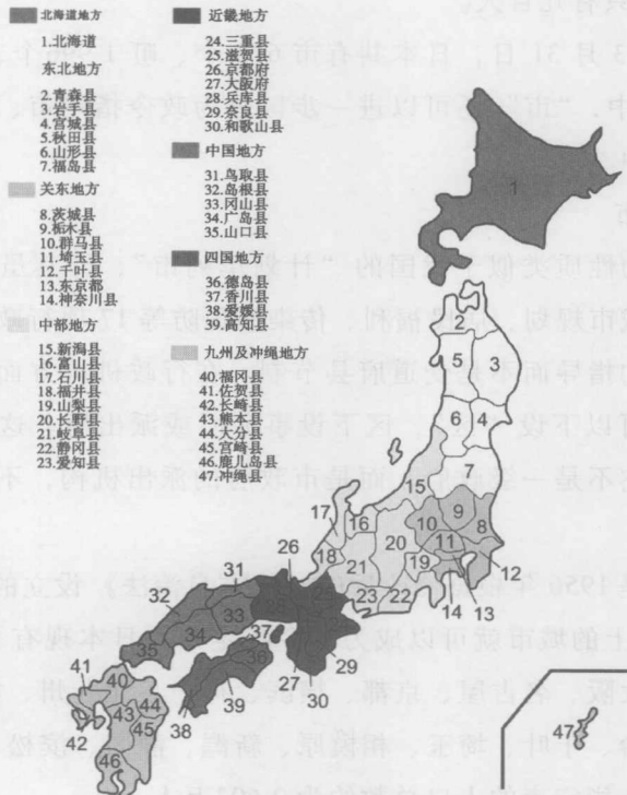
图 1-2 日本行政区划

所谓都、道、府、县，实际是日本 47 个省级地方政府的统称（见图 1-2），其中“都”指东京都，“道”指北海道，“府”指京都府、大阪府，“县”指余下的 43 个县。它们之间目前在法律地位、政治体制、行政权限上没有多大区别，其名称上的差别基本上是由历史原因造成的。