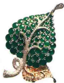
葉形群鑲翡翠胸針

中國人對翡翠玉石的特殊愛好自古有之，自遠古時代開始，人們就喜歡佩戴玉飾，且喜愛翡翠遠甚於黃金和其他玉石。在古代“君子無故，玉不去身，君子與玉比德焉”，並以玉的溫潤色澤代表仁慈，堅韌質地象徵智慧，不傷人的棱角表示公平正義，敲擊時發出的清脆舒暢的樂音視作廉直美德的反映。近些年隨着人們生活水平的提高，翡翠不再是貴族的專有飾物，而逐漸走入了人們的收藏視線。但是收藏翡翠要從哪些方面入手？如何應對瞬息萬變的翡翠收藏市場？如何去區分翡翠的A、B、C貨？怎樣辨別翡翠的種、水、色？這些對於收藏者來說都是必須要面對和解決的問題。