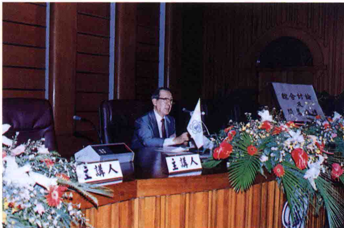
綜合討論及閉幕典禮