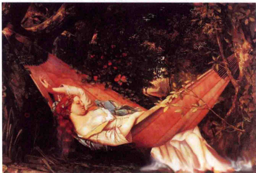
吊床上的金发女郎 古斯塔夫·库尔贝 画

梦揭示了人的真正本性，尽管不是他的全部本性，并构筑了一种把隐藏起来的内心世界通向我们认识的途径。