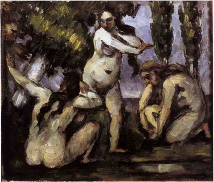
三浴女 保罗·塞尚 画

从精神疾病的康复的例证观察可以看出，虽然白天功能发挥正常，但梦生活依然处于精神病的影响之下。