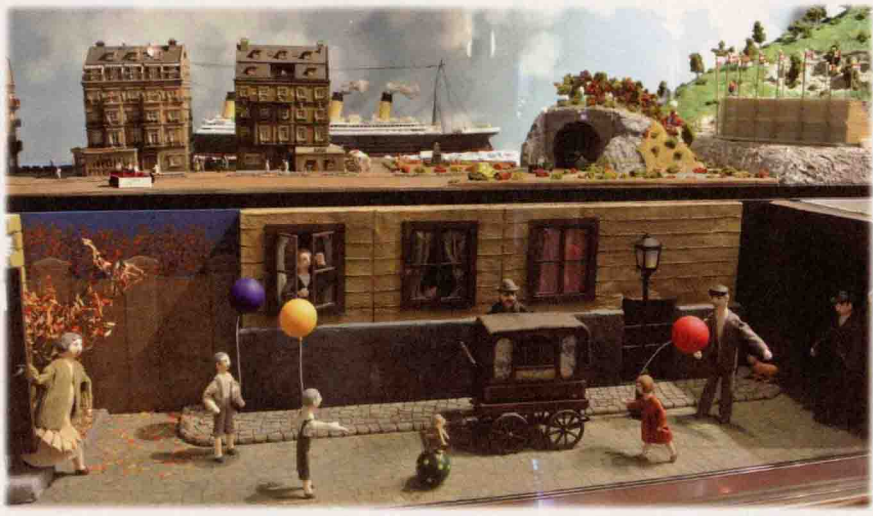
▲工業革命前後，人類的生活形成重大的對比；但平安和樂是眾人共同的希冀。

但是正如「月影總有另一面」，出生、生長於20世紀後的我們，其實也是一群中獎的幸運兒，能夠經歷人類史上的大繁榮時期。現在市井小民的尋常生活，幾乎都是古代帝王后妃的奢華享受。早在18世紀中葉，西方吹響工業革命的號角後，經過無數人類的累積奮鬥，如今我們一開水龍頭，乾淨清水就能嘩嘩而流；駕駛汽機車，通衢大道即可隨處通行；扭開電視機，千里影像近在面前；撥通電話響，訊息思念張口可說；飛機萬里翔，代替了驢馬的搖晃顛簸；網路無國界，一指天涯比鄰各地遊……。據聯合國統計，「貧窮」在過去五十年減少的速度，遠高於過去的五百年；而西元1800年以來，民眾的實質所得提高了九倍以上、預期壽命也超過了一倍。