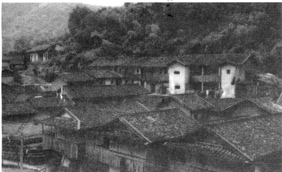
张公略故乡平远县热柘镇黄竹坪村，后排右二为其故居