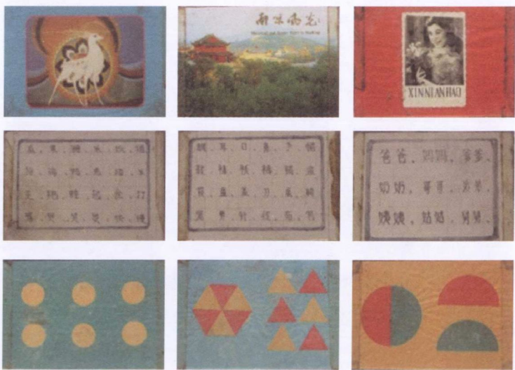
选自小雪爸爸的玻璃卡片