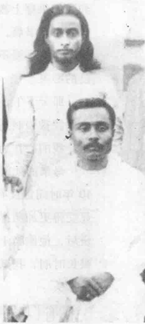
尤迦南达与哥哥在一起

当我们到达加尔各答的家时，只看到神秘的令人震惊的死亡场景。我一下子就垮掉了，几乎昏厥过去。许多年过去后，我心里才勉强接受了这个事实。在天堂的门口，我的大声号哭最后惊动了圣母。她的话语最终治愈了我溃烂的伤口。