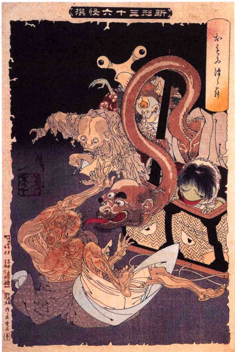
老木柜中的妖怪 月冈芳年 十九世纪

制作多年的厚实老木柜，似乎永远被遗忘在角落，里面放着一些同样被遗忘多年的物品及满箱的灰尘。然而，长久的忽视已经使它们变成了可怕的妖怪，某一天晚上，你忽然打开它时，呈现在眼前的将是如画中一样的恐怖情景。