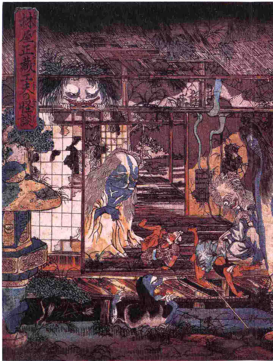
↑ “百物语”游戏 歌川国芳 十九世纪中期

“百物语”是江户时代流行的一种游戏，就是几个朋友半夜里聚在一起，点起许多蜡烛，然后轮流说鬼故事，说完一个鬼故事就吹灭一根蜡烛。据说，当第一百根蜡烛熄灭时，真正的鬼就会出现。图中描绘的即是蜡烛全部吹灭后，各色鬼怪争相现身的情景，令人毛骨悚然。