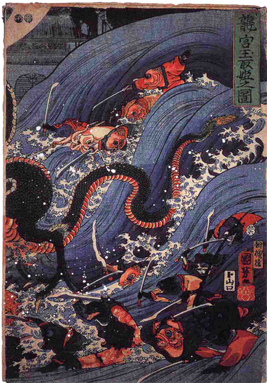
↑龙宫玉取姬之图（组图） 歌川国芳 十九世纪中期

玉取姬是美丽善良的海女，其潜入龙宫盗取龙珠藏入乳房中，后来又从乳房中切下龙珠击败恶龙的故事在日本妇孺皆知。此绘画是众多玉取姬图中最完美的一幅，波涛汹涌的蓝色大海，因愤怒而翻腾身軀的恶龙、挥舞兵器的虾兵蟹将及果敢挥刀切龙珠的王取姬，都赋予整个画面热烈、刺激、灵动的色彩。