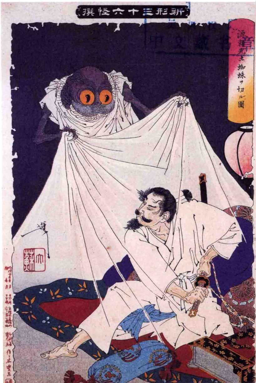
源頼光大战土蜘蛛 月冈芳年 十九世纪

土蜘蛛是一种体形异常巨大的蜘蛛妖怪，性情残暴，常将遇见的人用蛛丝牢牢绑住，然后带回山洞里食用。它的八足、獠牙、钢毛等都是非常锐利的伤人利器。平安时代著名的武士源赖光曾只身进入山中和这种妖怪大战数时，最终将其斩杀。