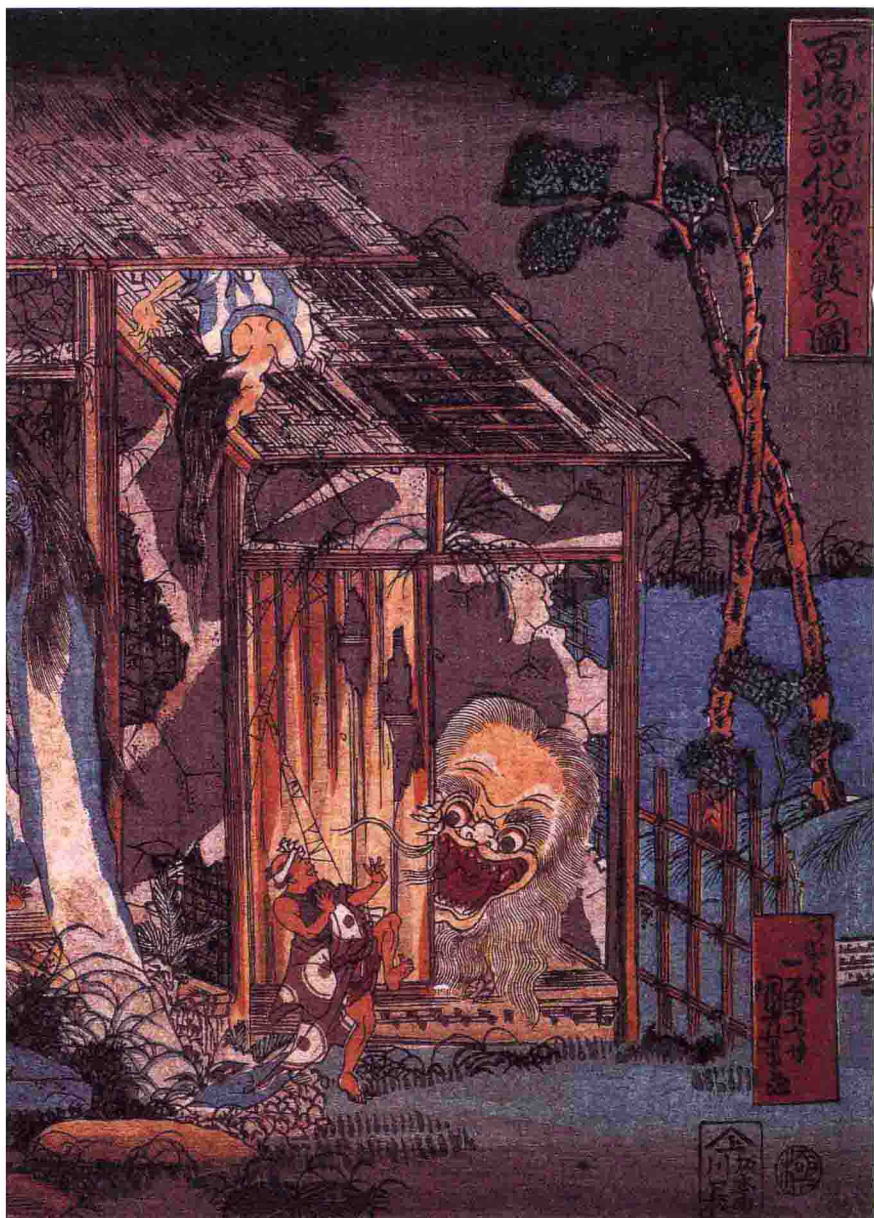
→豪杰比武(组图) 月冈芳年 十九世纪下半叶

绘画旁的题词为“豪杰奇术竞”，“竞”是竞赛、比赛的意思，所以此图描绘的应是众位英雄豪杰的一场比武盛会，类似“华山论剑”。只见豪杰们纷纷展示自己的强大本领；有搭弓射箭的，有凝神闭气的，有以静制动的，整个画面人物传神、色彩纯美。