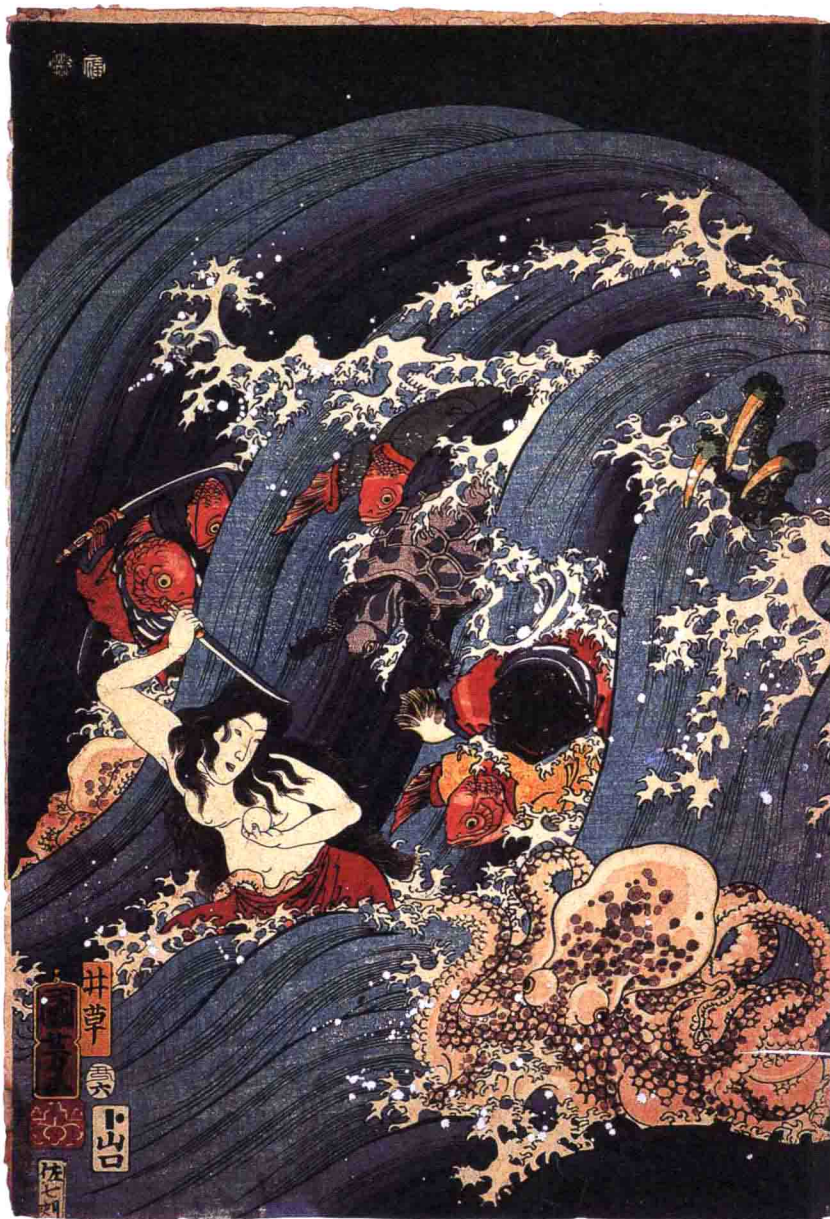
←歌声中的妖怪 歌川国芳 十九世纪上半叶

国芳在画中有“百人一首之内”的题词，“百人一首”指日本镰仓时代集合了一百位歌人作品的歌集。图中描绘的正是一位歌人沉醉于自己的歌声中，不料眼前突然出现一个一丈多高的妖怪，浑身漆黑，头发上逆，竟然跟着歌人一起和歌，吐出的歌词变成了阵阵白雾。