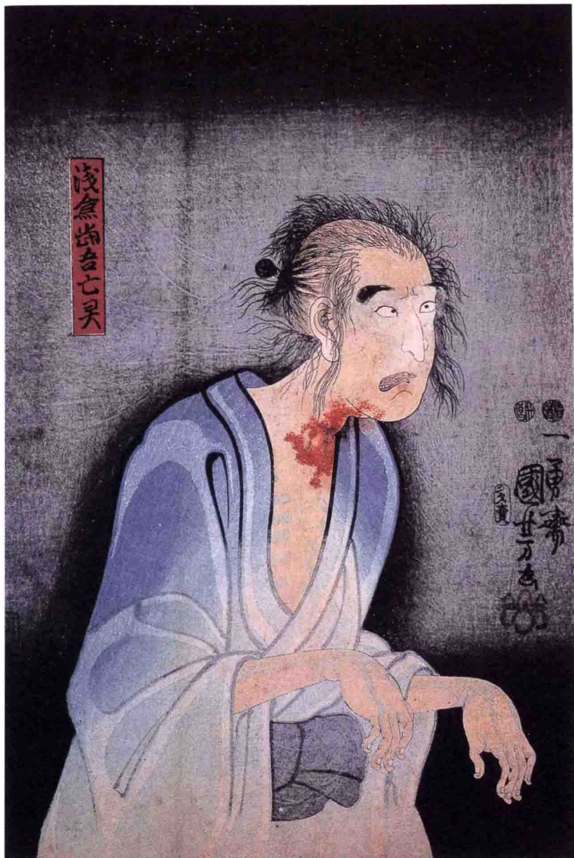
浅仓当吾亡灵 歌川国芳 1851年

图中题词为“浅仓当吾亡灵”，虽然浅仓当吾到底是何人，至今众说纷纭，难以定论。但这决不影响我们欣赏这个诡异的灵魂，它喉咙的伤可能是其成为亡灵的根本原因，稀疏头发扎成的小髻、夸张的眼白，国芳的写实手法让它有种难以名状的妖异、恐怖及空灵。