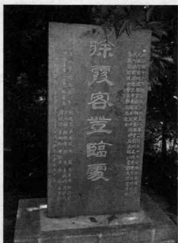
河池学院内的徐霞客登临处纪念碑