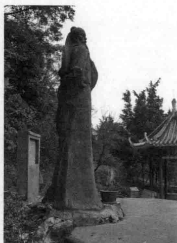
会仙山山腰的徐霞客塑像