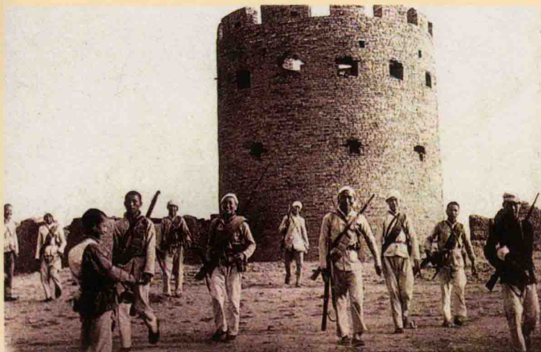
华北民兵攻克曲阳县下河镇日军据点。