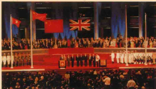
1997年7月1日凌晨，中英两国政府香港政权交接仪式在香港会议展览中心隆重举行。