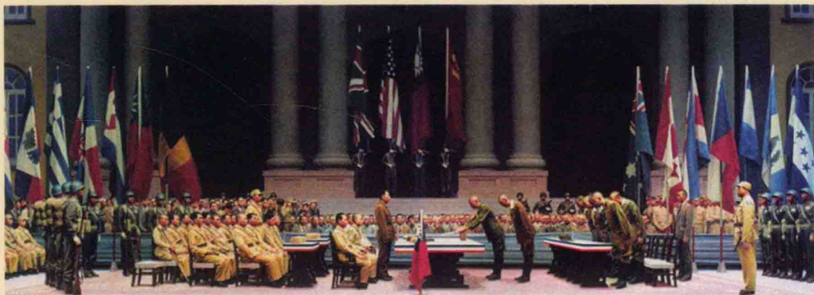
1945年8月18日，经过中国人民长达8年不屈不挠地斗争，以及美利间合众国对广岛、长崎的原子弹轰炸，日本政府终于宣布投降。（图为日本投降签字仪式。）