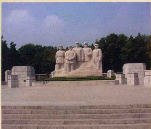
淮海战役前指委群雕。