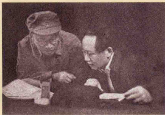
毛泽东、朱德在中共七大主席台上。