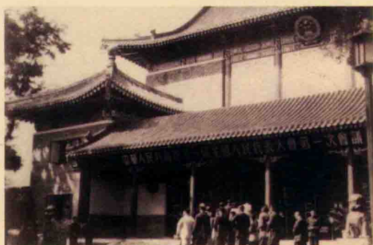
1954年9月15日至28日，中华人民共和国第一届全国人民代表大会第一次会议在北京中南海隆重举行。图为代表步入会场。