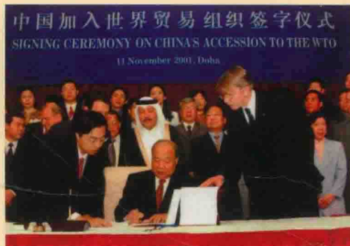
2001年11月10日，在多哈举行的世界贸易组织第四届部长级会议审议并通过中国加入世贸组织的决定。11月11日，中国外经贸部部长石广生签署了中国加入世界贸易组织协定书。