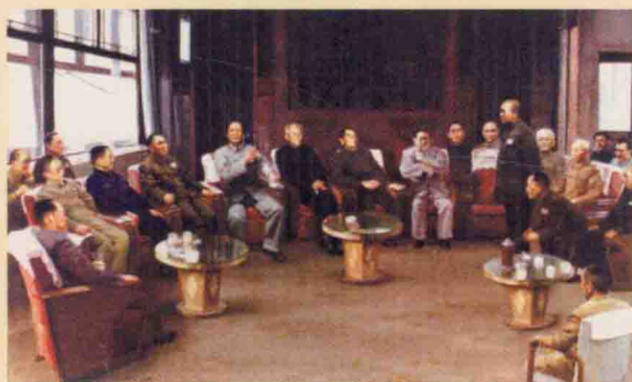
1950年6月25日，朝鲜内战爆发。美国随即打着联合国的旗号公然出兵干涉，并将战火烧到了中国鸭绿江边。10月19日，中国人民志愿军跨过鸭绿江，开赴朝鲜战场，与朝鲜人民军并肩作战。10月25日，抗美援朝战争正式爆发。