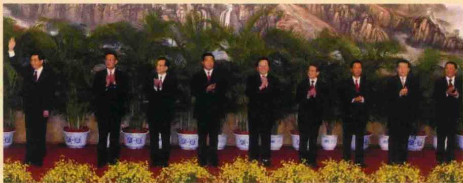
2002年11月15日，新当选的中共中央总书记胡锦涛和中央政治局常委吴邦国、温家宝、贾庆林、曾庆红、黄菊、吴官正、李长春、罗干在人民大会堂与采访十六大的中外记者见面。