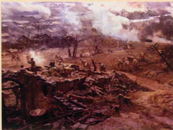
1948年9月12日，辽沈战役打响，战役历时52天，是中国人民解放战争中具有决定意义的三大战役中的第一个战役。