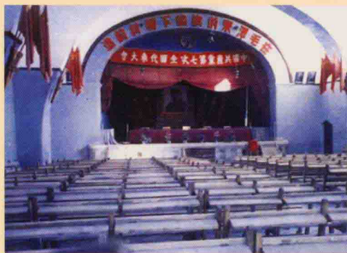
中国共产党第七次全国代表大会会址。