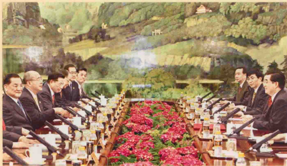
中共中央总书记胡锦涛在北京人民大会堂与中国国民党主席连战举行会谈。这是两党自1945年重庆谈判后再度举行的最高领导人会谈。