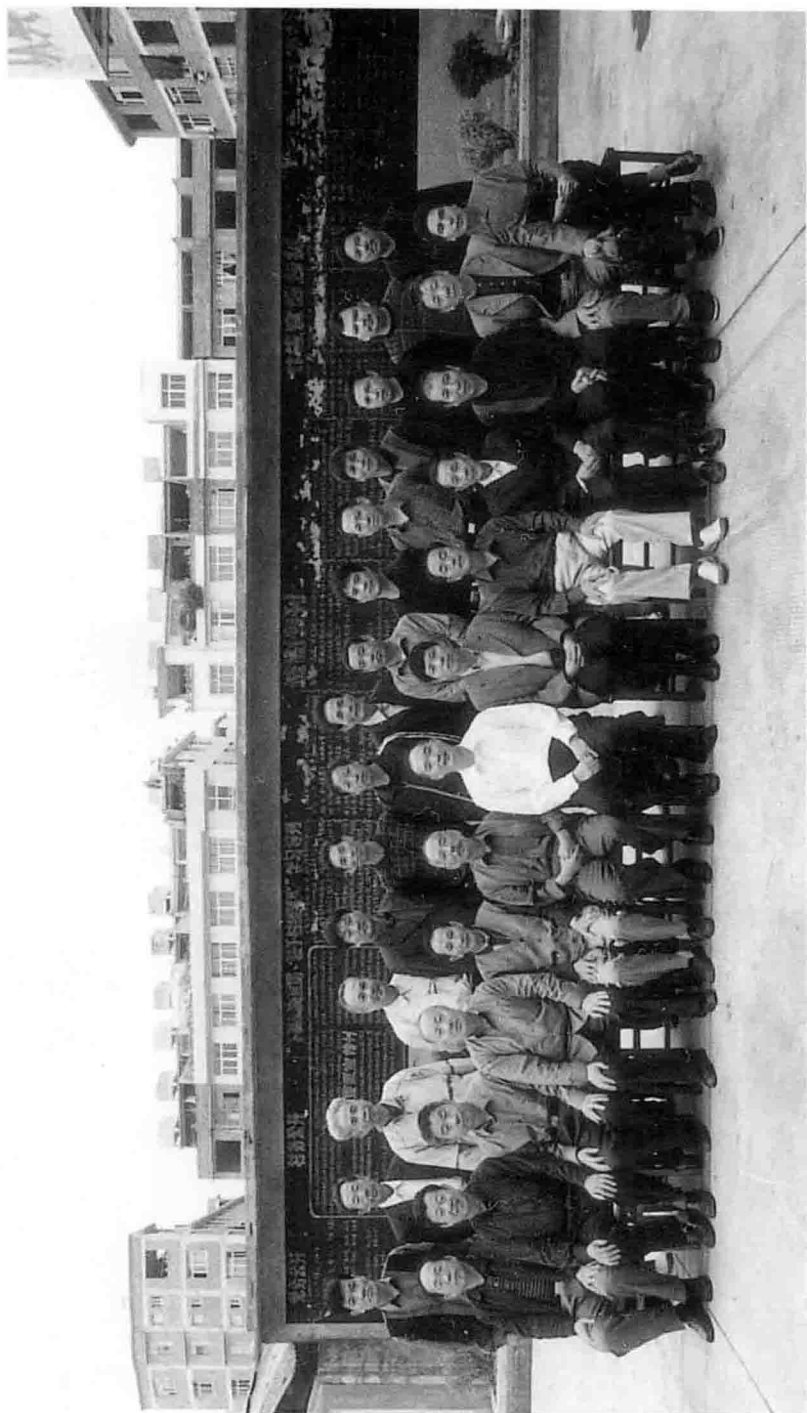
第一次在霞浦召开黄寿祺学术研讨会征文会议，全体代表合影（2006年）