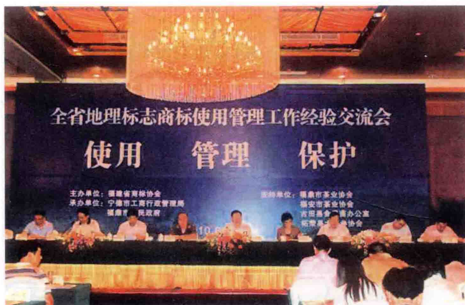
全省地理标志商标使用管理工作经验交流会2010年6月9日在福建省宁德福鼎市召开。宁德市工商局和“福鼎白茶”、“柘荣太子参”、“坦洋工夫”、“安溪铁观音”、“平和琯溪蜜柚”、“永泰芙蓉李”、“建宁通心白莲”、“南日鲍”、“政和工夫”、“连城红心地瓜干”等地理标志商标注册人在会上介绍经验