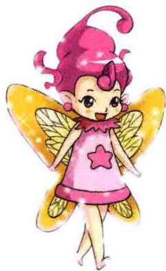
Soul of Light 光的灵魂