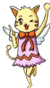
Fairy Cat 精灵猫