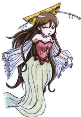
Soul of Night 夜的灵魂