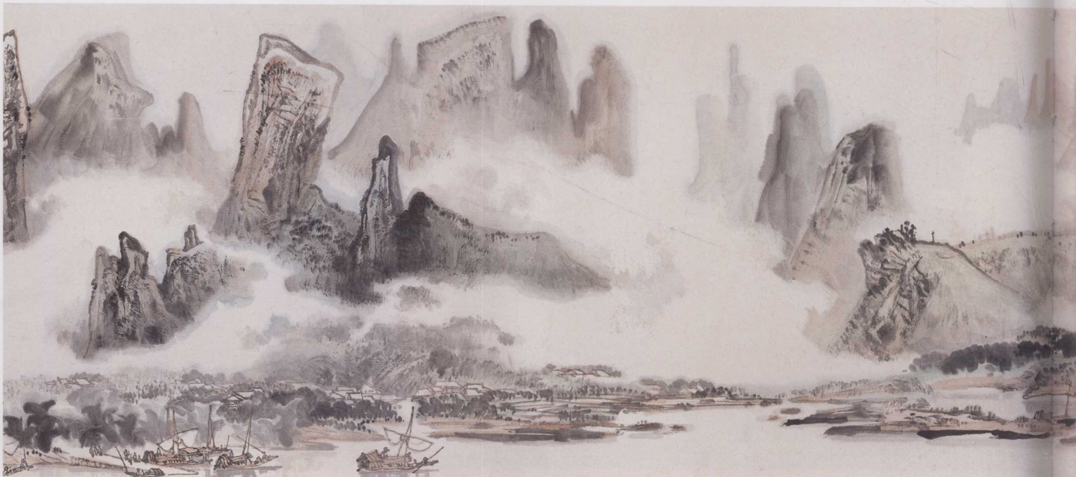
黄格胜 漓江百里图 (局部)