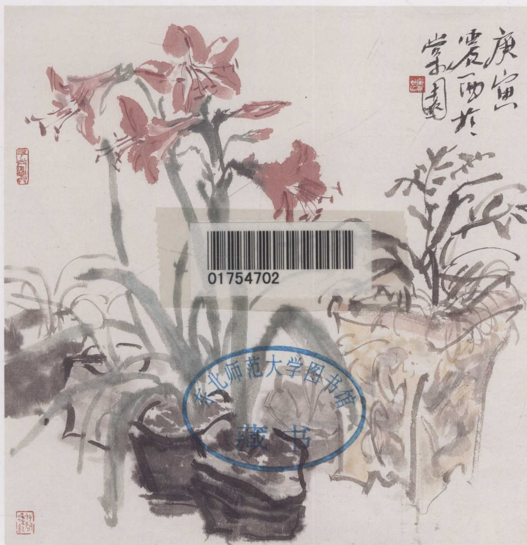
姚震西 圃中花 70 cm × 70 cm 2010年