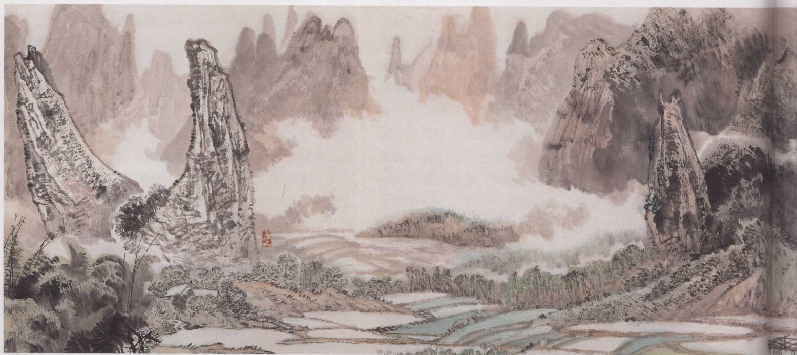
黄格胜 漓江百里图（局部）

对于“土”和“俗”的自觉追求，创造了黄格胜作品深沉的乡土意识和非同一般的田园意味。在其背后，在平淡的内层，有一种令人不易觉察的忧伤和怅惘。这种忧伤和怅惘是如此之隐蔽，如此之微婉，几乎无人能感觉到体会出。我虽然没有和作者交换过这方面的看法，甚至我想作者本人也许不会承认我的这种读法。但是，它确实实实在存在。我认为，它之存在而不为作者本人察觉，那只是因为它暗藏于作者的潜意识深处。那么它源于何处？心理学家认为，童年的经历对人的一生成长有着关键性的影响（更有认为有决定性作用的）。对于像黄格胜这样，出生于1950年，经历过“三年饥馑”年代、经历过“文革”，那些年代的阴影是一辈子也挥之不去的。在阅读晚年的巴金时，我常常被巴金那刻骨铭心、纠缠灵魂的痛苦深深震撼。晚年的巴金虽足以享受一生中难得的安详的时光，