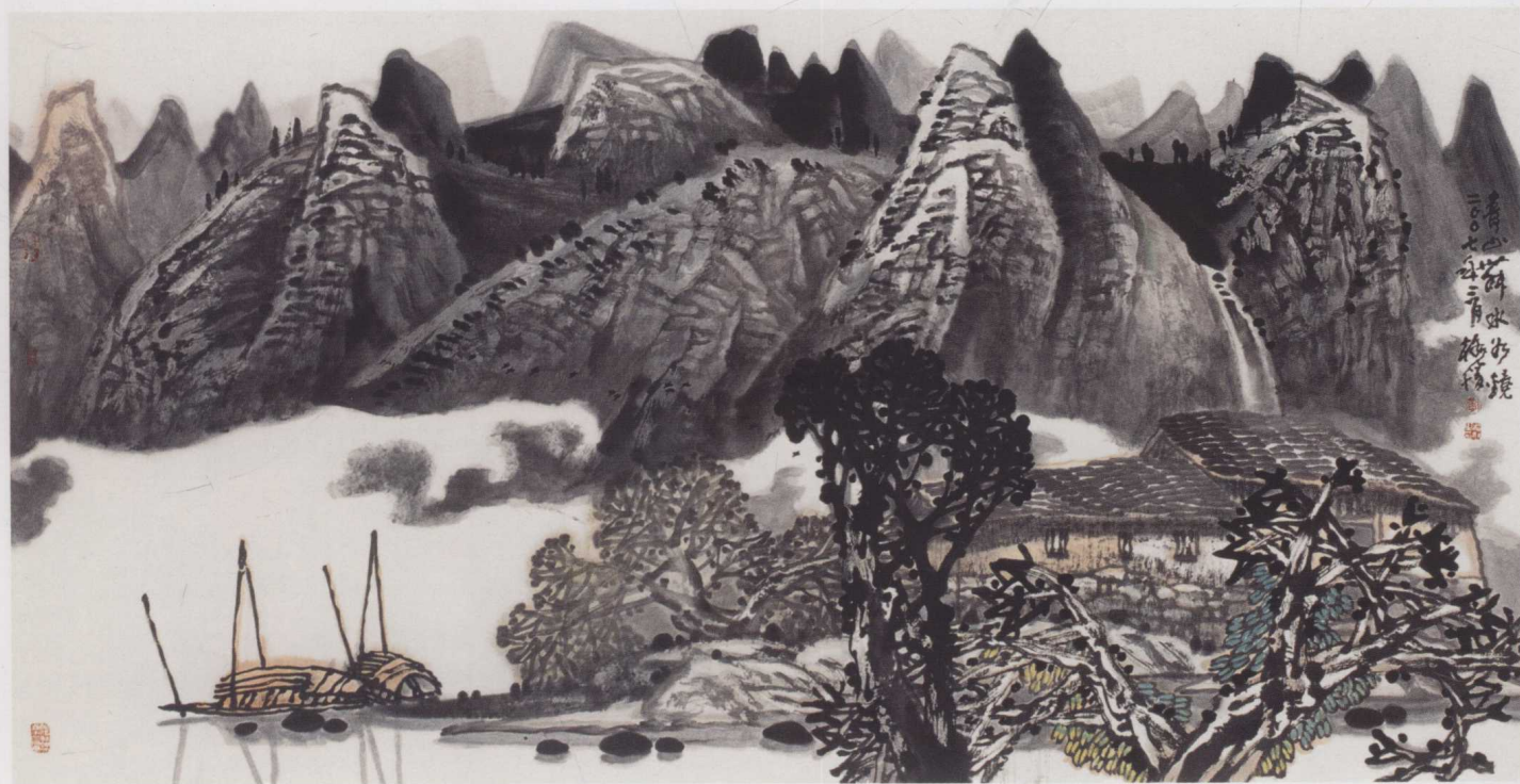
黄格胜 青山舞水如镜 2007年