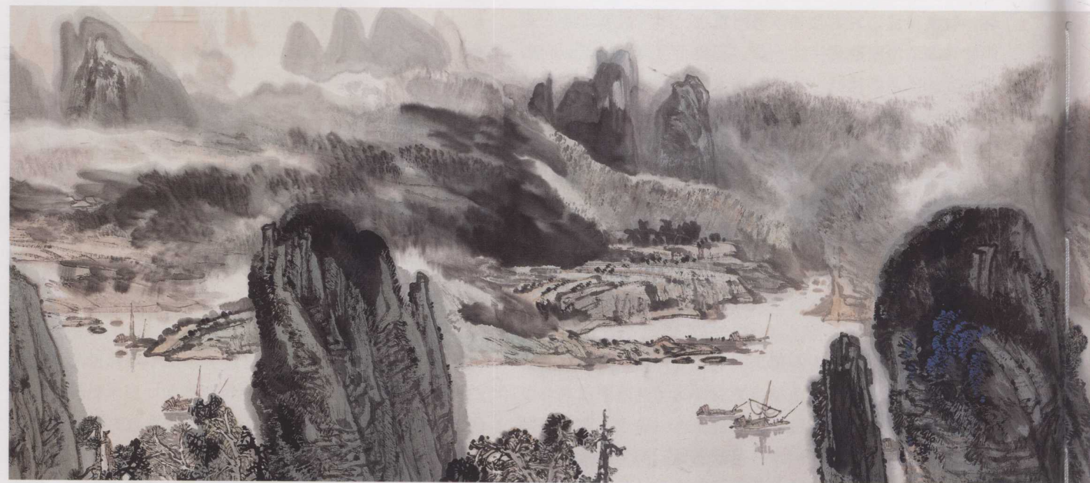
黄格胜 漓江百里图（局部）