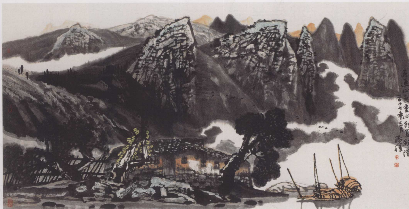
黄格胜 山外复斜阳 2007年