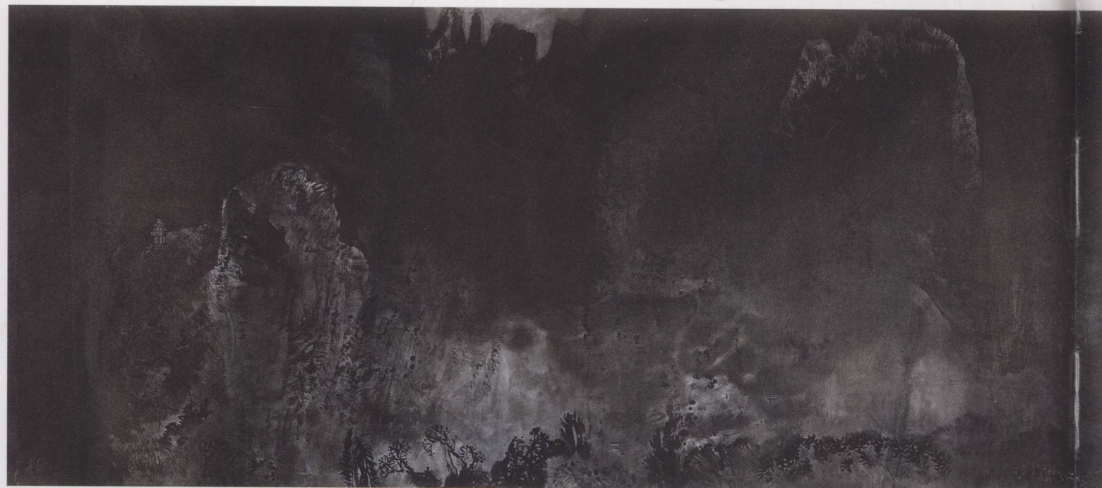
黄格胜 漓江百里图（局部）