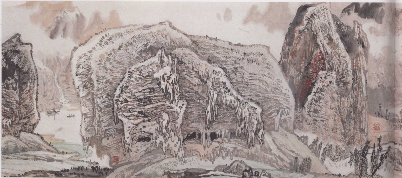
黄格胜 漓江百里图 (局部)