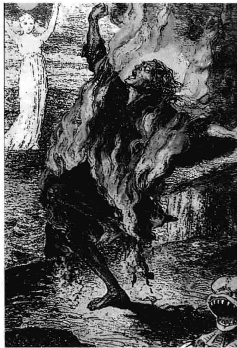
反映在古代壁画中的人体自燃现象

1951年，美国佛罗里达州圣彼得堡又发生了一起人体自燃案件。一位名叫利泽的妇人在家中被烧成灰烬，但是房中的其他木料却安然无恙。人们为了调查清楚这个神秘的案件，动用了当时各种先进的科学手段。时间过去了一年，通力合作的联邦调查局、纵火案专家、消防局官员和病理专家却没有解开这个