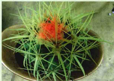
仙人掌类植物上着生刺、毛的器官称刺座

与其他植物相比，仙人掌类植物最大的特点是有一种独特的器官，叫刺座。刺座是变态的短缩枝，分布在茎上，大多数呈圆形或椭圆形并间隔一定的距离，常有稠密的毡毛，好像一个垫子。刺座上不但着生刺和毛，而且还可长出花、小球和枝。