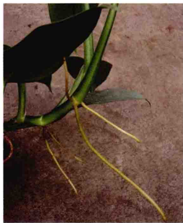
○银叶蔓绿绒的气生根○