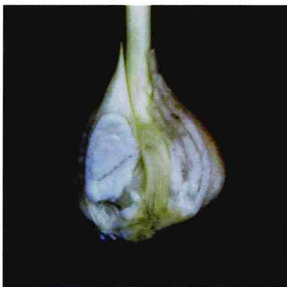
○郁金香鳞茎的切面○

④球茎。变态部分膨大成球形、扁圆形或长圆形实体者，有明显的节和节间，有较大的顶芽。我们吃的马蹄和慈姑就是典型的球茎。具有球茎的花卉有唐菖蒲、小苍兰等。