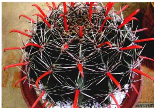
○仙人球类的茎肥大多肉，呈圆球形○