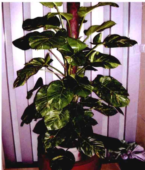
○绿萝作柱状栽培，称为绿萝柱○

植物叫做攀援植物或攀缘植物、藤本植物，如茛萝、绿萝、蔓绿绒类等。其茎又常称为蔓或藤。攀援植物常作为吊盆栽种和柱状栽培。