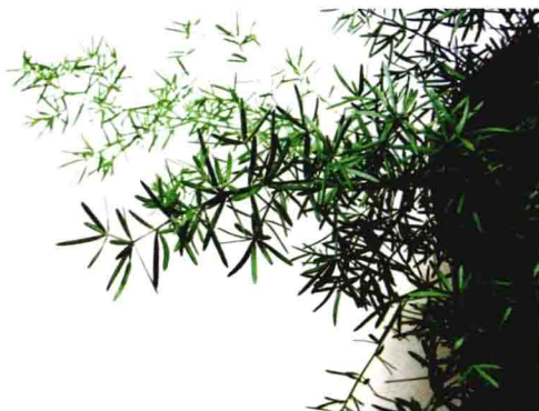
○天门冬绿色扁平、细条形的部分不是叶子，而是叶状茎○