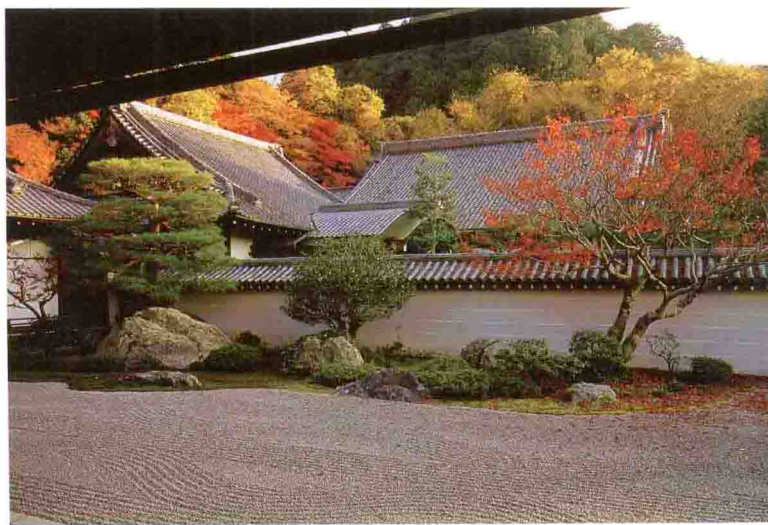
庭院前面有一大片的砾石空间，左后方是“虎引彪渡”的石组。