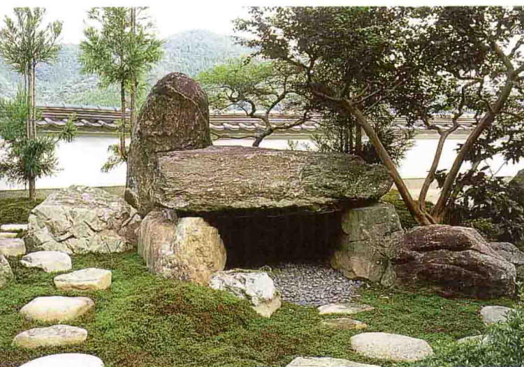
石洞窟是被认为能表达蓬莱仙境的意象石组之一，故以石洞窟作为庭院的一景。（设计/吉河功）