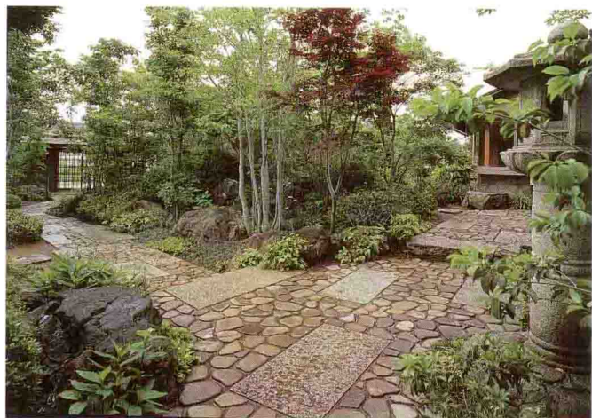
石径边的植物搭配要层次分明。小枹树、红叶、青皮、青枫等的组合，恰到好处地演绎出祥和安逸的风格。(设计/三桥一夫)