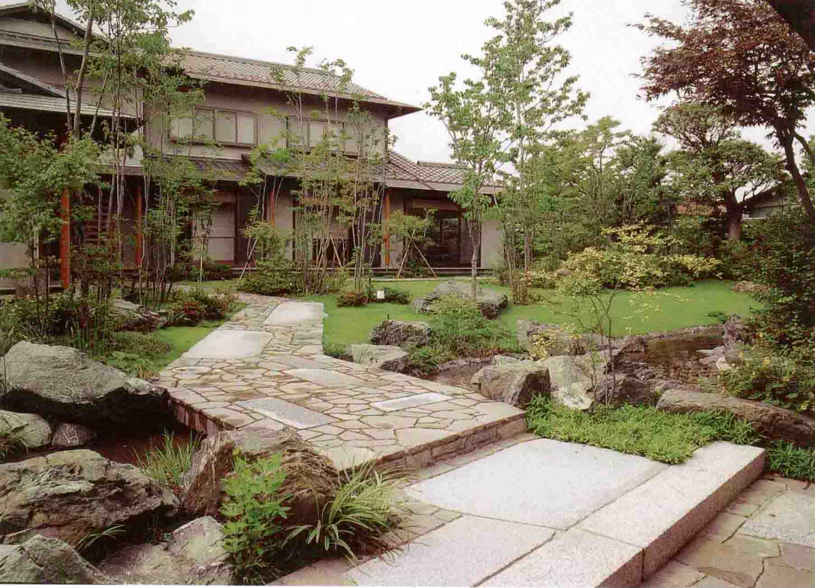
水在许多庭院中不可或缺的元素，能与其他元素共同构成美丽的水景。走在石板铺成的通道能眺望草坪中的杂木。 (设计/三桥一夫)