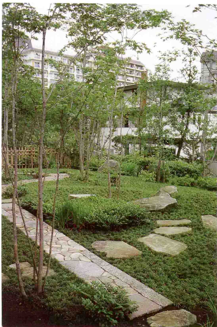
稀疏地栽植着高的红叶和青枫，以及矮的马醉木、桧木，以玉龙草作为地被植物，给人宁静舒适的感觉。