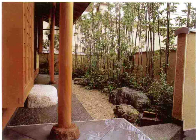
在较小的空间栽种树木，最好将部分树枝剪去，让叶片看似从树杆直接长出。(设计/三桥一夫)