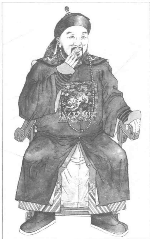
■ 陈赓祖父陈翼琼像