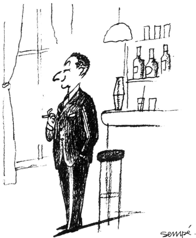
酒吧一角，勒内·戈西尼正沉浸在他的创作构思中。 (图右下方为桑贝签名。)

的名字都很奇怪：鲁飞，亚三，麦星星，阿薦，科豆什么的，而学监却叫做“沸汤”。好啦，勒内知道如何写这些故事了。