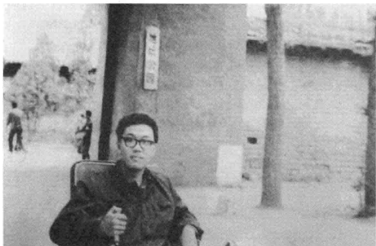
年轻的史铁生在地坛公园门口