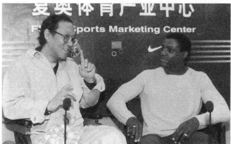
史铁生与偶像刘易斯