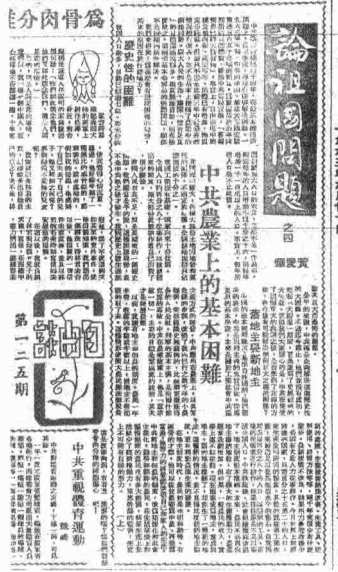
早期《明報》的“自由談”