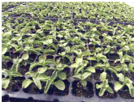
皇帝菊缺镁叶片向上卷曲