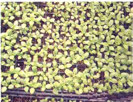
金鱼草镁等元素缺乏症状