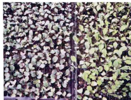
植物生长调节剂改善羽衣甘蓝着色效果