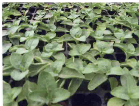
皇帝菊氮肥过剩症状