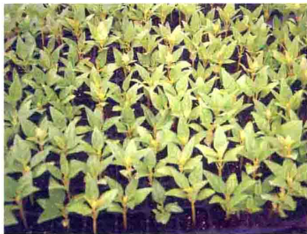
鸡冠花育苗IV阶段水分亏缺造成的“小老苗”