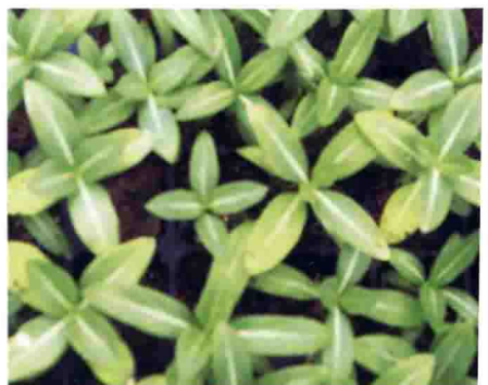
长春花多效唑中毒症状