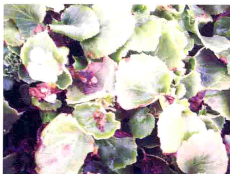
四季秋海棠真菌性叶斑病