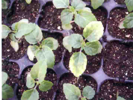
一串红花叶病毒病