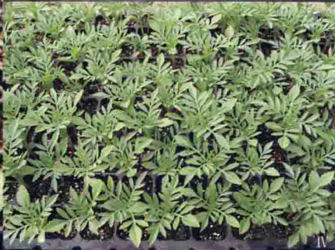
万寿菊穴盘育苗四个阶段