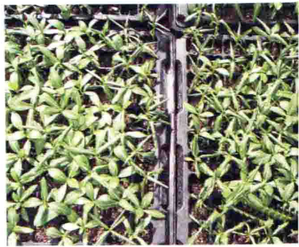
长春花缺水叶片萎蔫