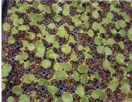
非洲凤仙缺硼顶芽发育不全