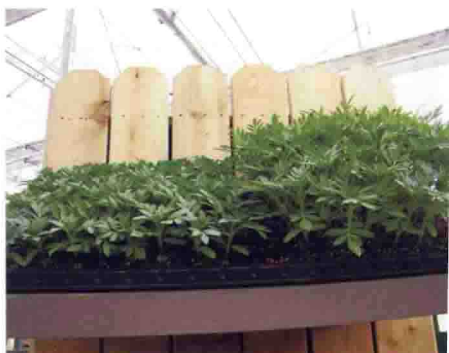
万寿菊施用植物生长调节剂后的株型控制效果