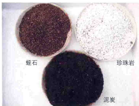
常用育苗基质成分