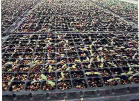
千日红覆土过薄引起下胚轴徒长