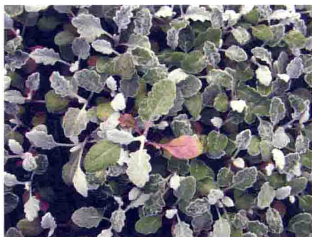
银叶菊缺磷下位叶变紫