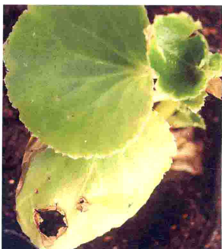
四季秋海棠细菌性叶斑病