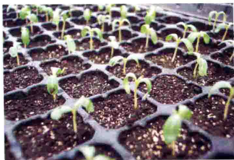
长春花温度过低叶片下卷