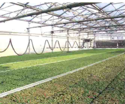
花坛花卉穴盘苗规模化生产