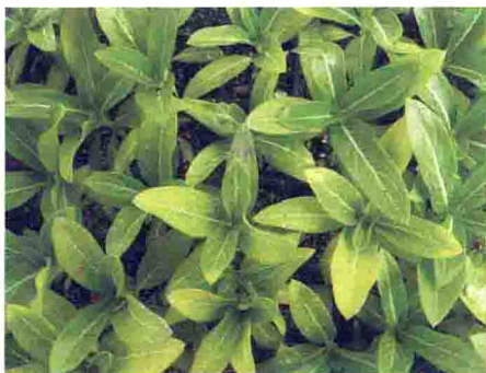
长春花缺钾早期症状