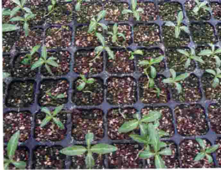
长春花未覆盖影响根系向下生长