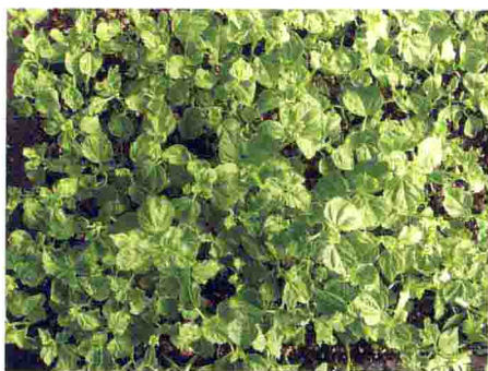
芙蓉葵杀虫剂药害症状