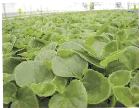
秋海棠缺水叶片发白