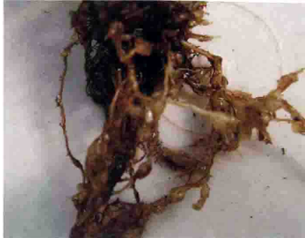
秋海棠根结线虫病