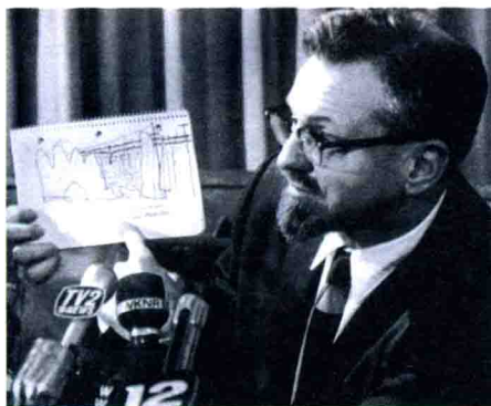
▲ 美国顾问海奈克展示 UFO 草图

在1966年3月的一次记者招待会上，美国空军蓝皮书作业组织的顾问海奈克展示一幅密歇根UFO目击者所绘的草图。美国政府自此开始调查UFO事件。