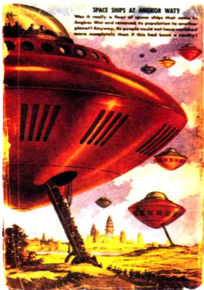
▲ 1939年出版的科幻杂志对UFO的模样做了艺术的再现。

根据拜尔德的日记，他曾于1947年2月率领一支探险队从北极进入地球内部，发现那里存在着一个庞大的飞碟基地，并生活着许多种原已在地面上绝种的动植物，并且他们还在这个基地上发现拥有高科技的“超人”。