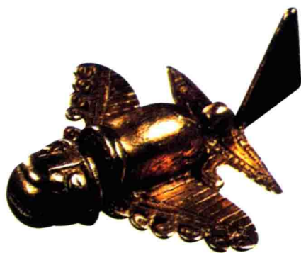
▲ 古希腊出土的青铜飞船模型

古希腊也发现了宇宙飞船，它与古印度的“战神之车”似乎有某种联系。这不禁让人猜想，古代地球上真有过外星人光临吗？